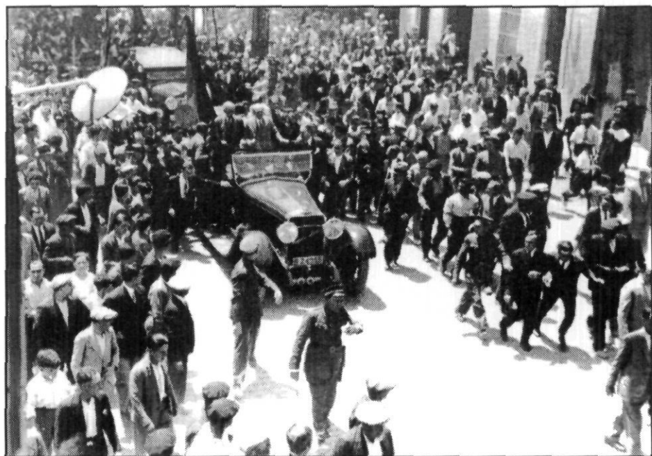
Visita de Francesc Macià a l'Ajuntament de Mataró i pujant la Riera.