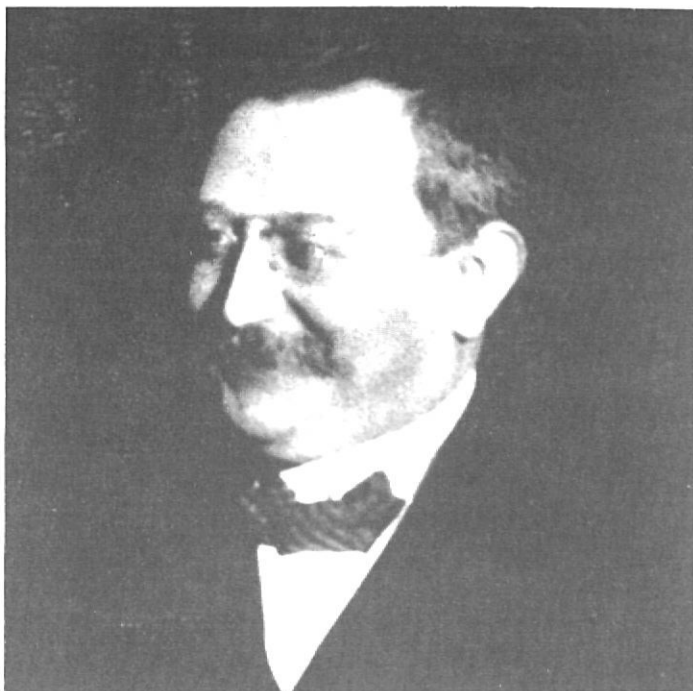
Pràct de la Riba. Gaziel va acabar per capgirar del tot el seu esquema doctrinal.

riografia nacionalista oficiosa: "La boira transfiguradora de la realitat històrica continguda en l'obra de Ferran Soldevila —afirmava— és la fe cega del patriotisme. Més que la història estricta és la història del Somni de Catalunya, tal com el feren les generacions catalanes de les darreries del segle XIX fins que, ja ben entrat el XX, i quan més adormits estàvem, vingué el violent despertar del 1936". Segons la crítica metodològica de Gaziel —que coincidia a grans trets amb la que ja havia apuntat Jaume Vicens Vives des dels anys trenta—, els historiadors nacionalistes emetien il·legítims judicis de valor segons uns criteris del segle XX d'actes realitzats a l'Edat mitjana i presentaven el procés històric "com un conjunt orgànic i encara vivent, animat per un esperit nacional únic, que és l'ànima catalana". El resultat eren històries "melangioses i delirants apologies", una barreja d'afalacs sentimentals, fervor patriòtic i oportunisme polític, raó per la qual Gaziel reclamava una nova història de Catalunya que fos alhora objectiva, explicativa i útil: "una Història de Catalunya que es deixés per sempre més de contar el que hauria hagut de ser i no fou, per dir-nos el que ha estat i el que és per veure si així podríem arribar, per fi, a veure clarament el que pot ser".