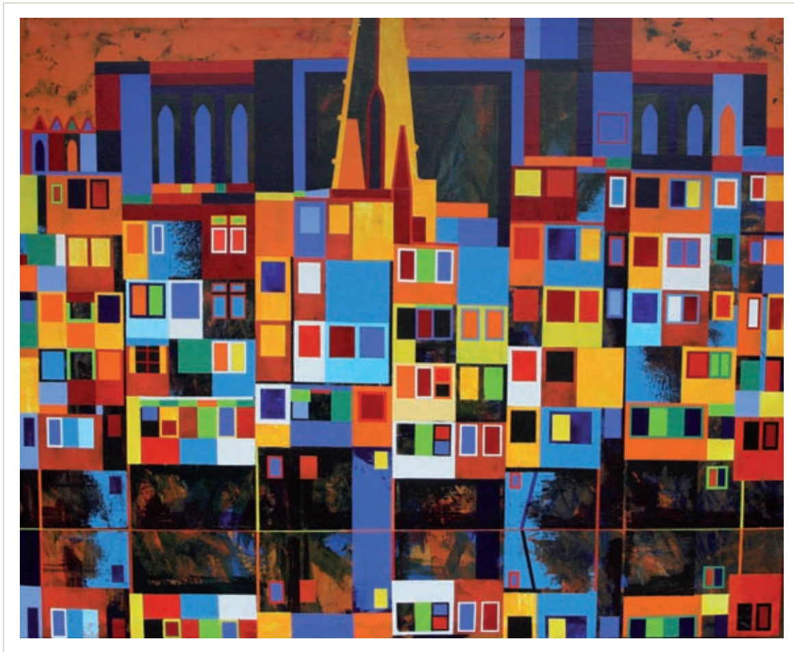
Finestres , 2012, 132x162 cm. Acrílic sobre tela.

diferenciar i al mateix temps d'honorar la figura del pare. També va passar per lliure per la Facultat de Belles Arts de Barcelona, però em recalca que quan va tenir el primordial contacte amb l'art contemporani va ser gaudint de la Beca Castellblanch a París, a finals dels seixanta. Allà va tenir l'oportunitat de conèixer què es coïa en el món artístic internacional, i de sortir de la Girona levítica que aclaparava gairebé tothom qui es volia dedicar a les arts.