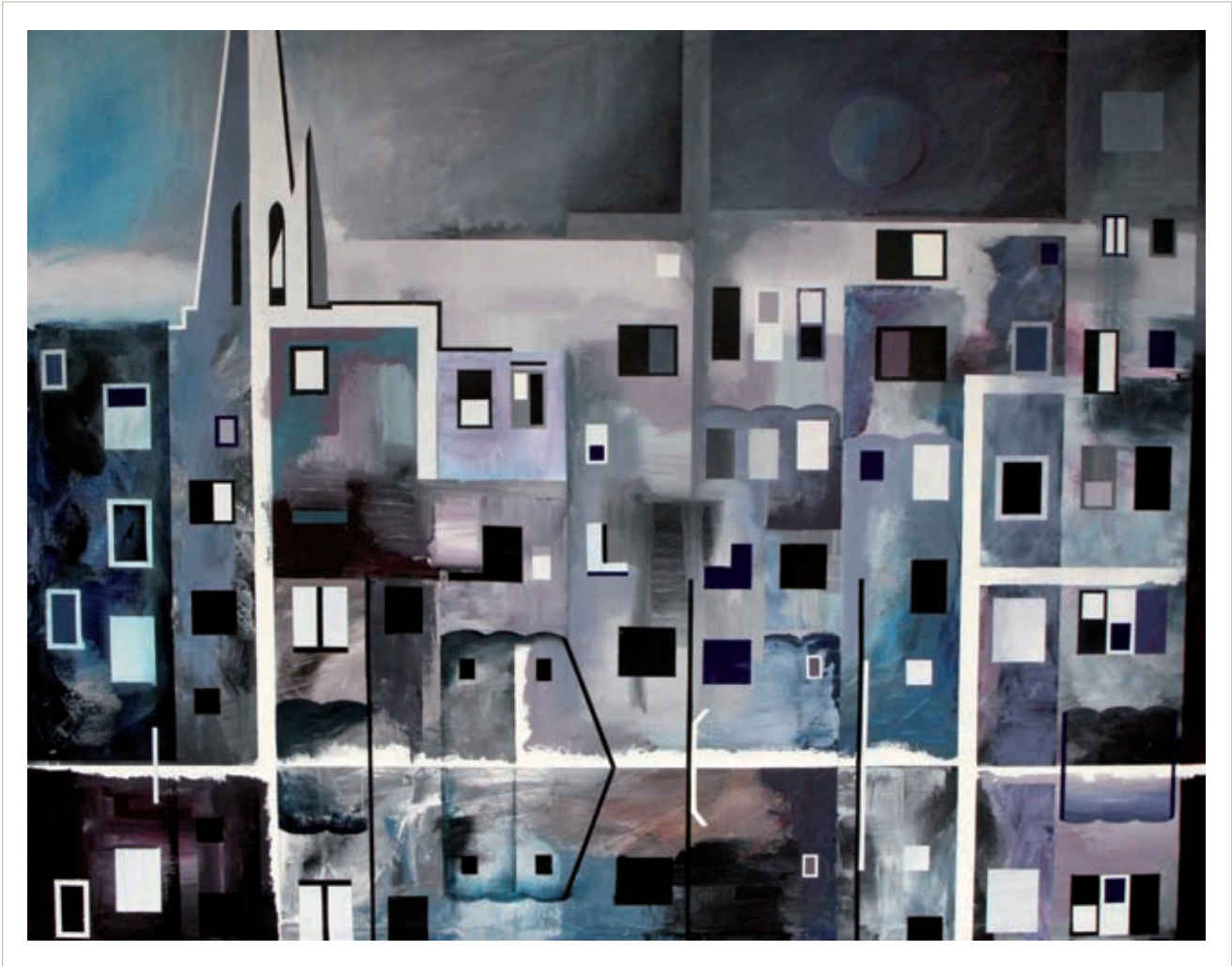
Gris , 2013, 130x162 cm. acrílic sobre tela.

amb aquests conceptes no vol combregar-hi. L'art és l'art, com el còmic és el còmic, i les mitges tintes són una enganyifa. Tampoc no es vol creure els suposadament artistes que, havent tingut una idea, després d'annotar-la en un bloc, la fan realitzar o produir a un tècnic, a un càmera de vídeo. En Perpiñà reivindica l'ofici i saber-lo portar a terme i, dolgut, em diu que a ell i la seva obra se'ls ha tractat com de residu, i a aquests entorns no els vol donar treva. Em repeteix la consigna: «L'art és l'art».