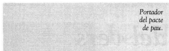
Portador del pacte de pau.