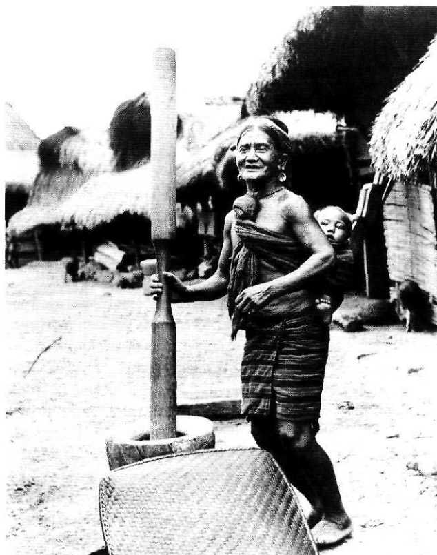
Preparant el menjar.