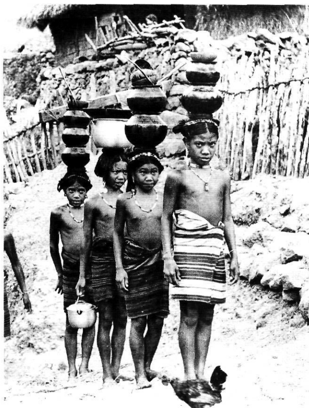
L'aigua portada a casa.