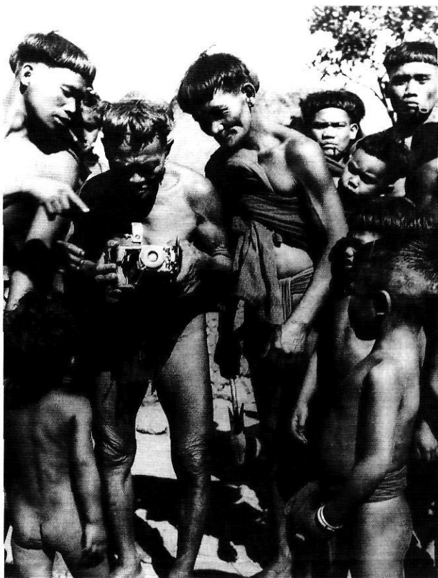
Investigant una càmera Butbut, Tinglaya, Kalinga 1948.