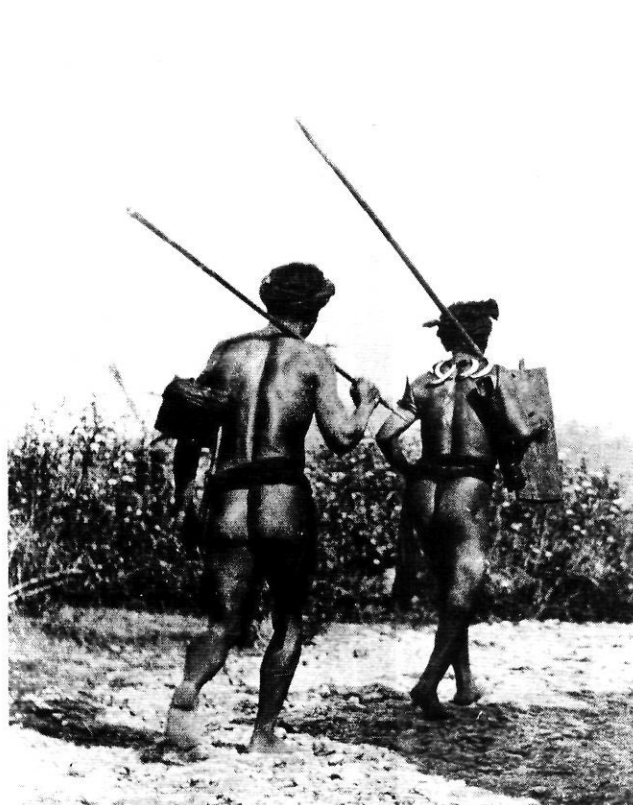
Sagada Mountain, Province, 1936.