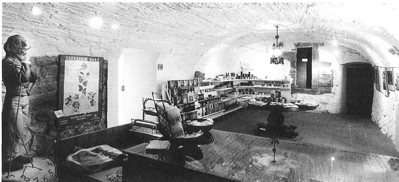
Botiga del Museu del Castell de Púbol.

No dubtem, però, a qualificar l'actual llei de museus com una eina vàlida de planificació del mapa museístic català. És per aquesta raó que advoquem pel seu total desenvolupament. Efectivament el model de xarxes horitzontals (temàtiques), vinculades a un museu nacional, és una bona via per articular museísticament el país.