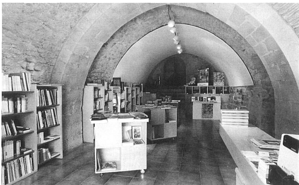
Libreria del Museu d'Art de Girona.

En aquesta preocupació per la captació de nous recursos que mantinguin el nivell de l'oferta dels nostres centres, no hem d'oblidar la possibilitat d'esponsoritzacions, a través de contractes de publicitat, o d'altres fórmules, com la creació de fundacions privades que donin suport als nostres museus. Nogensmenys, aquest model és de difícil aplicació en els nostres museus territorials, la prova n'és la situació real. Aquesta dificultat per trobar espònsors i patrocinadors segurament té a veure amb la insuficient llei 11/1982 de fundacions privades, publicada en el DOGC núm. 206, de 10 de març de 1982, i sobretot en la també insuficient llei 30/1994, de Fundaciones e Incentivos Fiscales a la Participación Privada en Actividades de Interés General, publicada en el BOE núm. 282, de 25 de novembre de 1994, que haurien de ser modificades per tal d'oferir incentius fiscals més