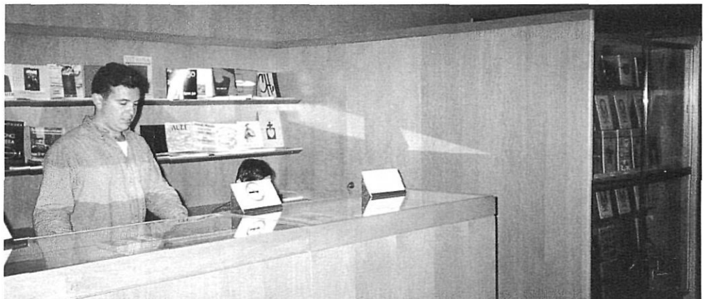
Botiga del Museu Comarcal de la Garrotxa.

Actualment, l'element que ha fet trontollar els fonaments dels museus catalans, bàsicament els territorials, ha estat la desarticulació de l'antiga Xarxa de Museus Locals i Comarcals i sobretot l'aplicació parcial de la Llei de Museus de 1989: és a dir, la no-creació d'alguns museus nacionals, imprescindibles per articular el territori, com el Museu d'Etnologia de Catalunya; la creació de seus centrals de museus nacionals que poden arribar a absorbir la quasi totalitat dels recursos; l'oblit de l'article 32.1 de la llei, que obliga la Generalitat de Catalunya a col·laborar econòmicament amb els museus registrats. Oblit que en àrees com la gironina s'ha pal·liat a través de la col·laboració entre Generalitat i Diputació de Girona, mitjançant el Pla de Museus.