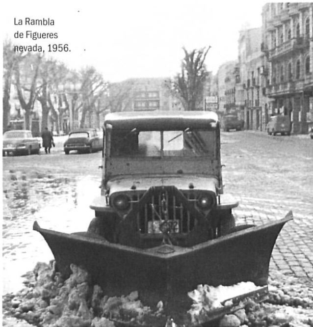
La Rambla de Figueres nevada, 1956.

ment. La saba és aigua amb minerals i compostos per nodrir l'arbre i el fruit. Quan la temperatura baixa molt, per sota dels 12 graus sota zero, durant moltes hores, l'aigua es gela i augmenta de volum i fa que els vasos que la condueixen no puguin aguantar la pressió i s'acabin trencant, com va passar el febrer del 1956.