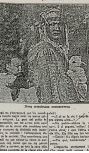
Dona musulmana marroquina