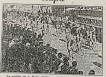
La sortida de la Volta Ciclista a Catalunya.