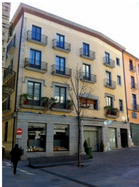
>> Casa familiar dels Montsalvatge a Girona.

Els Montsalvatge es lliguen amb la frondosa història de la Girona contemporània gràcies a tres membres il·lustres: Francesc Montsalvatge Fossas, Xavier Montsalvatge Iglésias i Xavier Montsalvatge Bassols