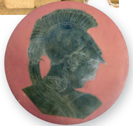
AUTOR: JOAN COROMINA PUJOL (1909).

Van haver de passar gairebé 20 anys perquè els esforços de Corominas es veiessin coronats finalment per l'èxit