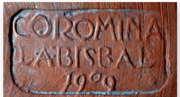
>> Plata imitació de cerámica àtica i segell «COROMINA / LA BISBAL / 1909» (col·lecció particular).

cediments d'elaboració: de goig perquè habèm pogut observar que la rutinaria indústria cerámica bisbalenca, [...] ha adquirit un grau de perfeccionament y un caràcter decoratiu y artístich embejables. L'amich Corominas, [...] ha ob-