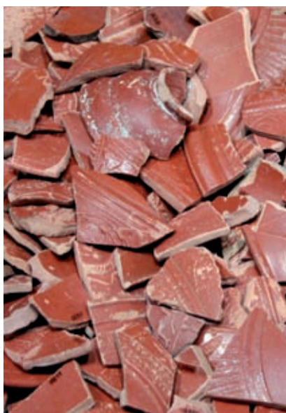
>> Terra sigil·lada sud-gà·lica.

aplicació a la ceràmica y a lograr el seu noble y desinteressat propòsit ha sacrificat anys y més anys y bona part dels fruits materials del seu treball [...] No es, donchs, en Joan Coromina un teòrich; és un mestre teòrich y pràctich tot d'una pessa, qu'ajuntant aquestes dugues condicions està cridat a exercir una influencia decisiva, en sentit progressiu y veritablement artístich, sobre l'industria ceràmica bisbalenca».