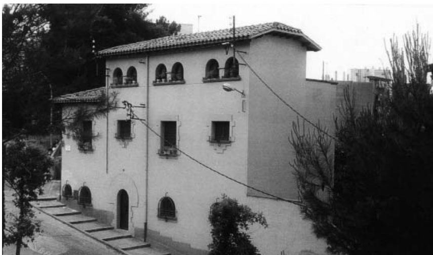
Estat actual de l'antiga casa Baró, a la pujada de les Pedreres de Girona.

«Hasta el presente en Gerona no existía con carácter permanente el comercio de las flores, por lo que creemos un acierto la apertura de una tienda de ese género ya que con ello se facilita la adquisición por parte del público de ese elemento ornamental que cada día aparece más imprescindible para embelle-