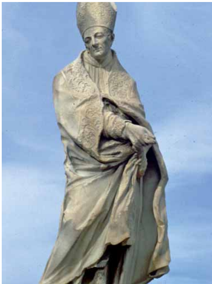
Fig. 1. Santo Tomás de Villanueva. Giacomo Antonio Ponsonelli.

La siguiente intervención de Antonio Pontons en cuestiones municipales que lo relaciona con la República de Génova se vincula con el proyecto de construcción de un muelle de piedra en el Grao de Valencia con el objeto de crear un puerto para la ciudad. De nuevo en este caso encontramos la presencia del círculo de los novatores valencianos 14 algunos de los cuales ya habían coincidido con Pontons en las obras del río. De hecho, en la comisión inicial