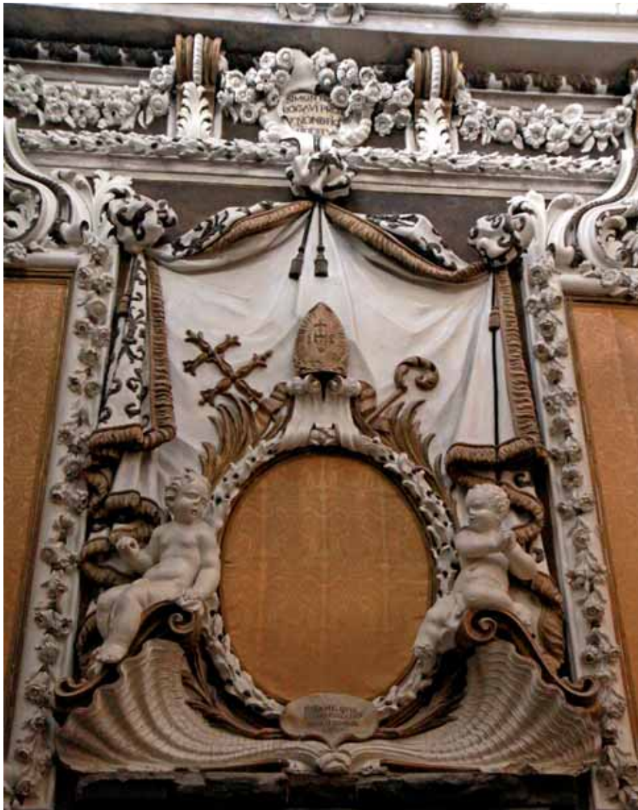
Fig. 8. Parroquia de San Pedro en la Catedral de Valencia. Antonio Aliprandi.

por Aliprandi tras su estancia en Valencia es la decoración de la Sacristía del monasterio de Heiligenkreuz en 1708. 53