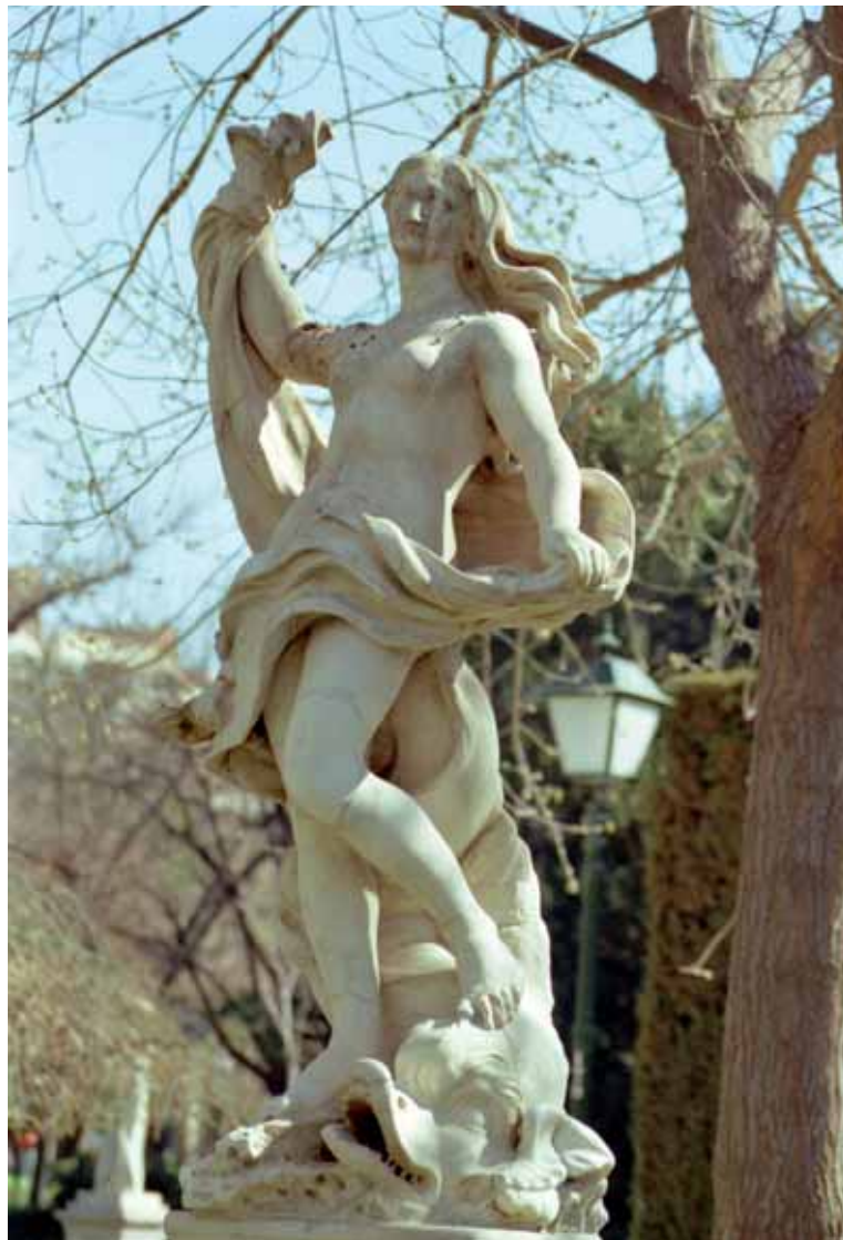
Fig. 2. Venus. Giacomo Antonio Ponsonelli.

es superior al que se conserva. En total se cuentan nueve esculturas mitológicas, Ceres, Flora, un viejo calentándose, Baco, Apolo, Diana, Venus, Neptuno y Tritón, dos perros y cuatro pirámides a modo de surtidores de fuente. Todo realizado en mármol a excepción de los perros que eran de piedra.