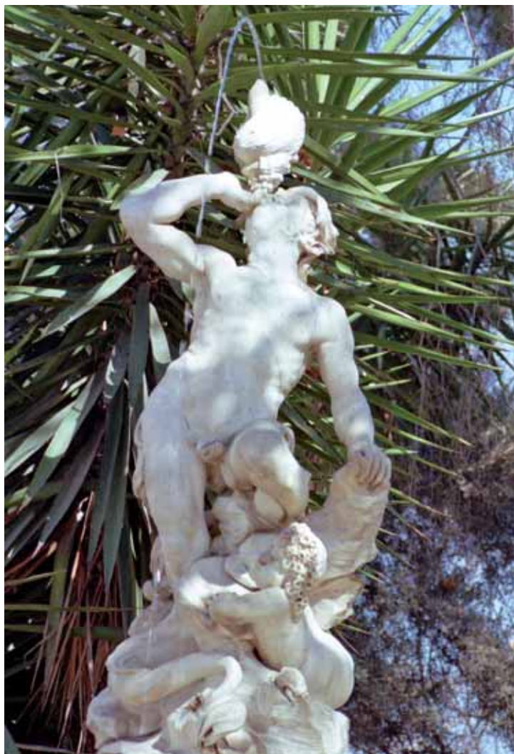
Fig. 3. Tritón. Giacomo Antonio Ponsonelli.

Esta era la disposición original de las esculturas pero, ya a principios de siglo xx, y antes del derribo de la casa solariega, las esculturas que han llegado hasta nuestros días se encontraban en su ubicación actual. 21 En la Glorieta Neptuno, en el Parterre la más grande de las esculturas, Tritón, y en los Jardines del Real las esculturas que el Barón de San Petrillo describe como «las cuatro estaciones» y que representan a Venus, Diana, Apolo y Plutón. 22