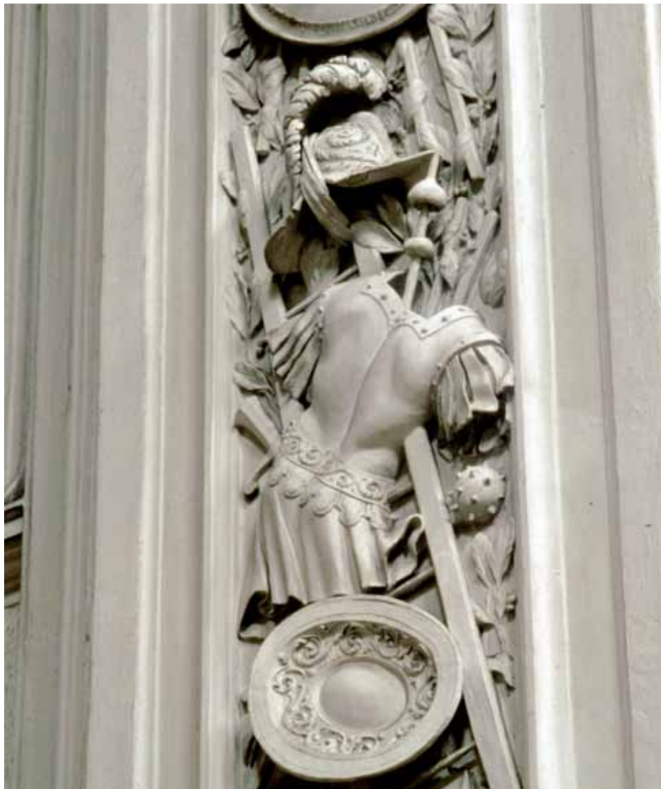
Fig. 6. Servitenkirche (Viena). Giovanni Battista Barberini.

rial austriaca. 48 En 1699 se documenta la última obra de Antonio Aliprandi en Austria antes de su partida hacia España. Se trata de unos pagos por obras en la sede del antiguo Ayuntamiento de Viena a Antonio Aliprandi y Johann Baptist Rueber, ambos estucadores. 49