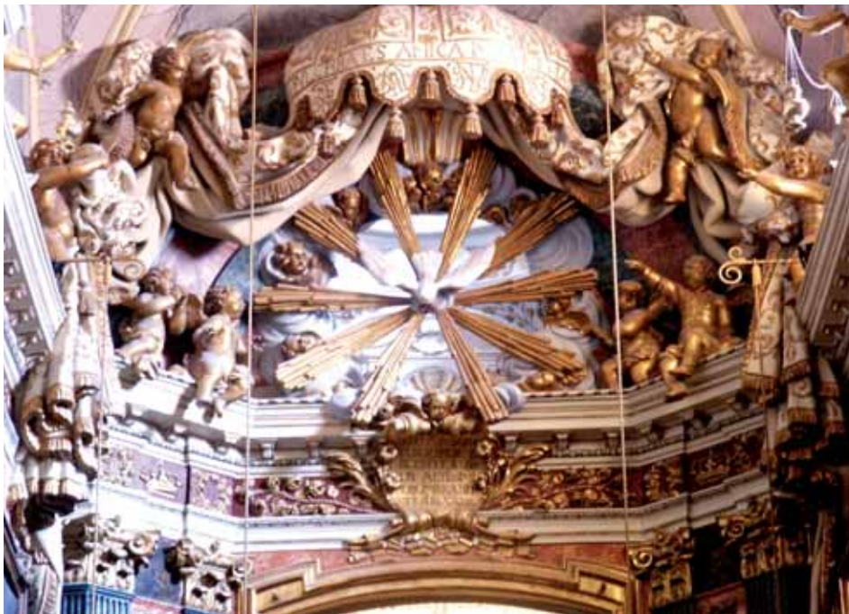
Fig. 10. Templo del Milagro de Cocentaina. Antonio Aliprandi.