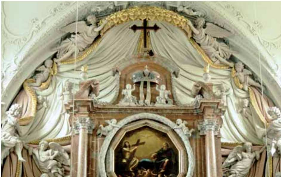
Fig. 7. Altar mayor de la Catedral de Linz. Giovanni Battista Barberini y Giovanni Battista Colomba.

Aproximadamente en torno a 1700 Antonio Aliprandi aparece en la ciudad de Valencia, permaneciendo en tierras hispanas al menos hasta 1705. Durante estos años se conoce su participación en el revoque del templo de los Santos Juanes, 50 en la capilla de San Pedro en la Catedral de Valencia, en la capilla de la Purísima en la desaparecida iglesia de los Jesuitas 51 y en el templo del convento de la Virgen del Milagro en Cocentaina. 52 La única obra conocida realizada