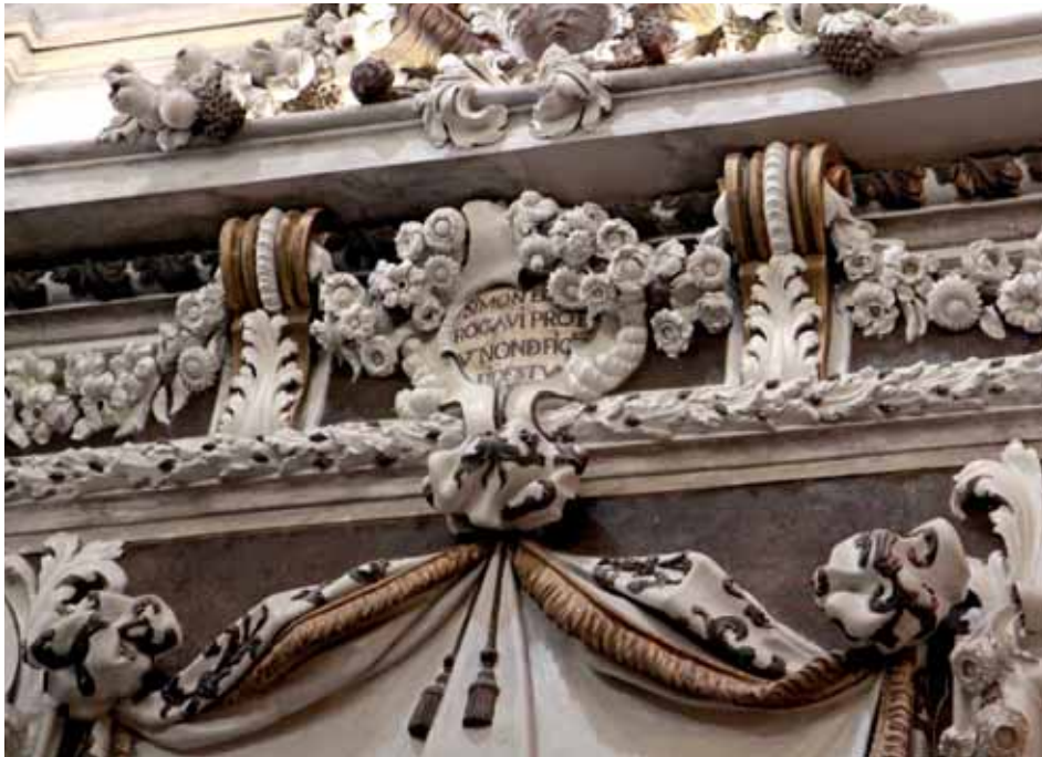
Fig. 9. Parroquia de San Pedro en la Catedral de Valencia. Antonio Aliprandi.