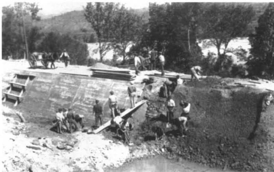
Obres de reparació del canal principal l'any 1952. Al fons s'observa el riu Segre, a prop de la presa d'Anyà.

la destresa dels pagesos, de les collites i dels preus de venda dels productes. En aquell moment res més insegur! La majoria dels pagesos de l'àrea d'influència del canal d'Urgell, fins aleshores de secà, no estaven avesats a les pràctiques del regadiu. A més, la conducció de l'aigua pel canal va evidenciar les primeres errades tècniques en no preveure una xarxa de desguàs, i els primers regadius van fer aflorar el salobre dels sòls. La conjunció d'aquests factors va derivar en la pèrdua