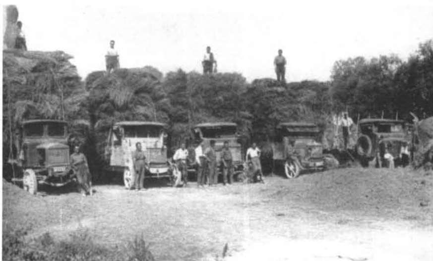
Camions carregats de les garbes que s'havien de portar als locals de la Casa Canal el 1926, des d'on s'administra l'aigua.

L'augment dels rendiments va ser significatiu a partir del 1900. El gràfic número 2 ho palesa en el cas del blat i l'ordi. En aquest procés, però, no només va contribuir la generalització del regadiu, sinó que també fou important la utilització progressiva dels fertilitzants químics. Efectivament, en aquest mateix gràfic s'observa que l'increment més important dels rendiments de l'ordi i el blat va produir-se durant la dècada de 1920. De fet, és també justament durant aquests anys, després d'haver resolt els problemes de subministrament d'adobs generats per la I Guerra Mundial, quan l'expansió dels fertilitzants químics és més important. En aquest cas, per tant, la relació de causa i efecte és força evident. I, en conseqüència, aquest increment