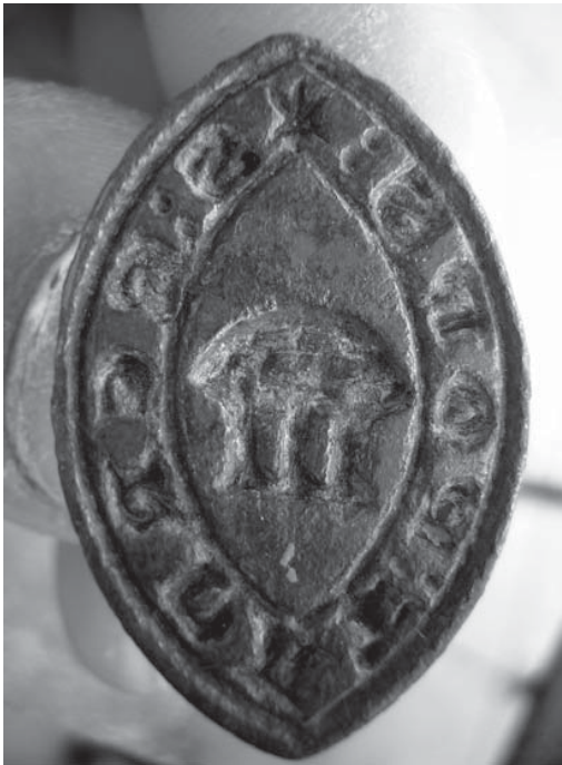
Figura 1. Matriu del segell.