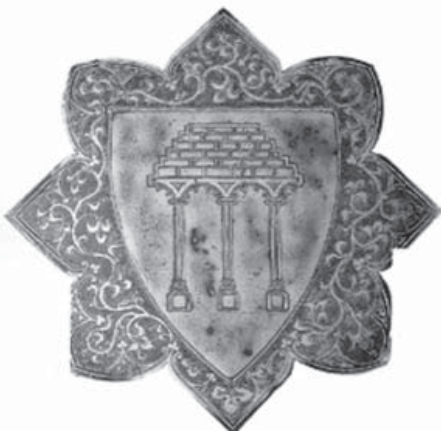
Figura 11. Senyal dels Pons en un laude sepulcral a la catedral de Palma de Mallorca (segle XV).

D'època posterior, segle XV, tenim a la catedral de Palma de Mallorca, una interessant laude sepulcral fet amb metall, amb la senyal dels Pons: un pont de dos ulls amb la part superior molt semblant a la senyal que porta la matriu estudiada.