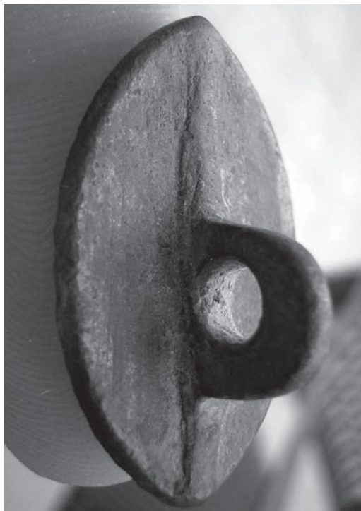
Figura 3. Revers del segell.

observar a la Sigil·lografia Catalana de Ferran de Sagarra, concretament a l' Inventari, descripció i estudi dels segells de Catalunya, Tom II , dintre de la Setzena Sèrie - Particulars , l'existència d'un segell molt semblant a la matriu de les fotografies.