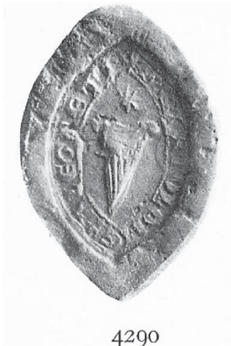
Figura 6. Segell de Guillem de Serra (1323) extret de la Sigil·lografia Catalana de Ferran de Sagarra, tom II, número 4.290.

V.- Que en el mateix Tom II del Inventari trobem els segells 2237 i 2238. Són dos segells que ens presenten, ocupant tot el camp, la mateixa senyal heràldica que la matriu del segell estudiat: un pont. Corresponen a dos segells rodons de Berenguer Despont, de 16 i 18 mm. de diàmetre respectivament. El primer, va ser usat entre els anys 1364 i 1378 i el segon és de 1381.