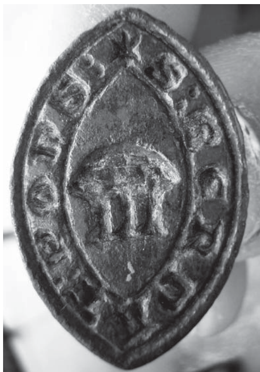
Figura 4. Simetria especular del segell.

IV.- Que la forma biogival que presenta aquesta matriu de segell es rarament usada pels particulars als Països Catalans a l'Edat Mitjana, és més comuna en els segells dels eclesiàstics. No obstant s'ha pogut