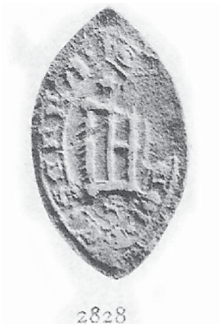
Figura 5. Segell de Guillem de Serra (1323) extret de la Sigil·lografia Catalana de Ferran de Sagarra, tom II, número 2.828.