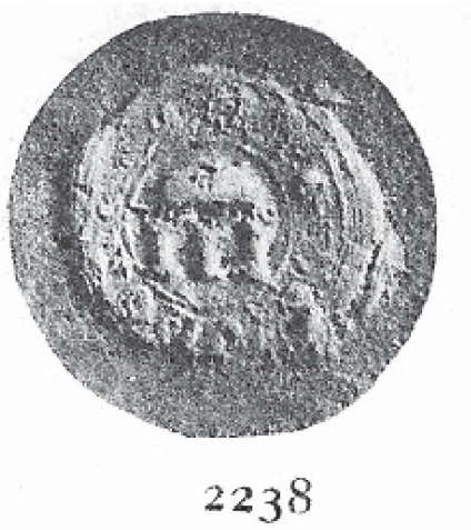
Figura 8. Segell de Berenguer Despont (1381) extret de la Sigil·lografia Catalana de Ferran de Sagarra, tom II, número 2.238.