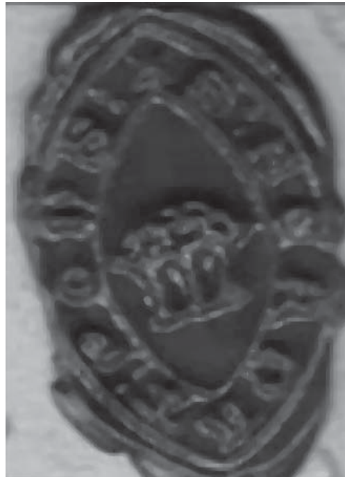
Figura 2. Empremta del segell.