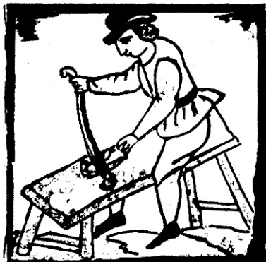
Dibuixos antics que representen diversos oficis.