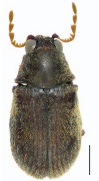
Figura 1. Stagetus cobosi n. sp. Holotypus. Escala 0,5 = mm.

estret i el quart poc sortint; la suma dels artells del funicle més curta que la dels artells de la maça. Últim artell dels palps maxil·lars (Fig. 5) molt llarg, estret i acuminat a l'apex.