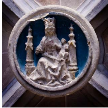
Rosetó de la volta del cor renaixentista.

Destaquen a l'interior certs elements ornamentals com el manteniment de pintures murals a l'absis de la capella de Sant Joan, a la nau de migdia, d'estil barroc; el cor renaixentista decorat amb quatre elegants figures dels evangelistes i un rosetó a la clau de volta amb la imatge de la mare de Déu de l'Heura. Element important en una església és la pica beneitera que a Santiga és del s. XVI.