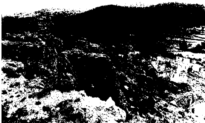
Vista d'algunes de les enderrocades estructures del castell de Selma sobre el poble abandonat. Selma fou una comanda templera i, més tard, hospitalera.