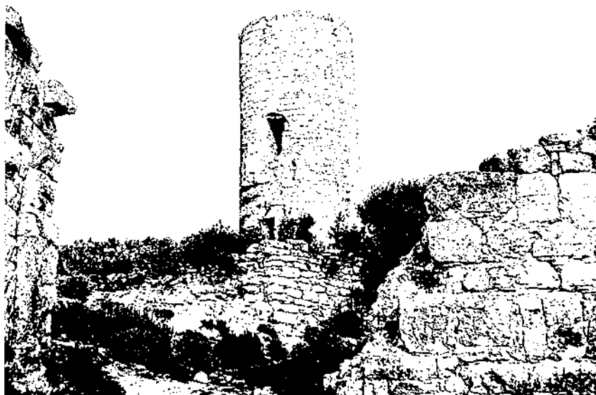
Alterosa torre circular del sector nord del castell de Saburella que, com la majoria de castells d'aquest sector de la conca del Gaià, fou propietat de la família Cervelló.

Els Armengol continuaren essent senyors de Montagut, com també eren senyors de Rocafort de Queralt. L'any 1706 Antoni II d'Armengol