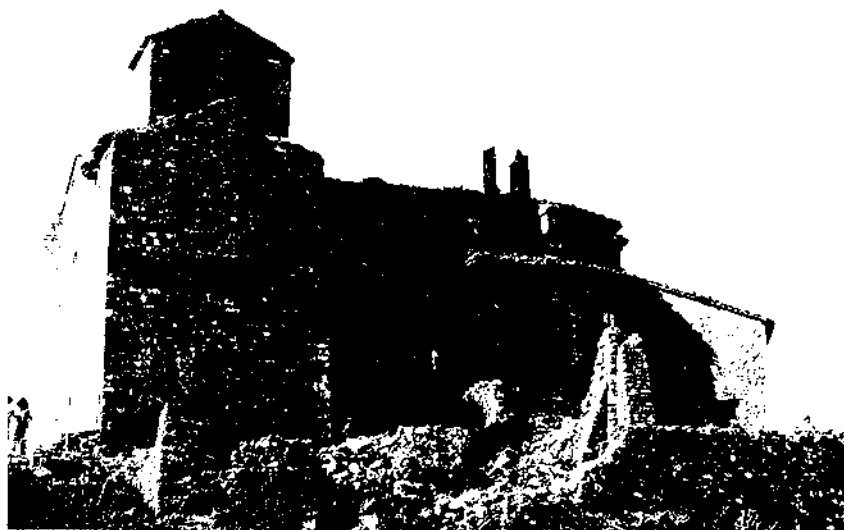
L'atrotinada església de Sant Jaume de Montagut, per la seva majestuositat, obliga a pensar en els anys que li foren propicis i que cada cop són més llunyans.