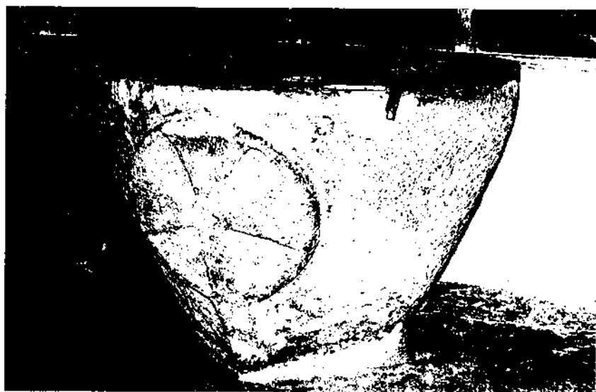
Pica baptismal d'immersió del segle XII-XIII procedent de l'església de Sant Jaume de Montagut actualment ingressada al fons d'art romànic del Museu del monestir de Santes Creus.