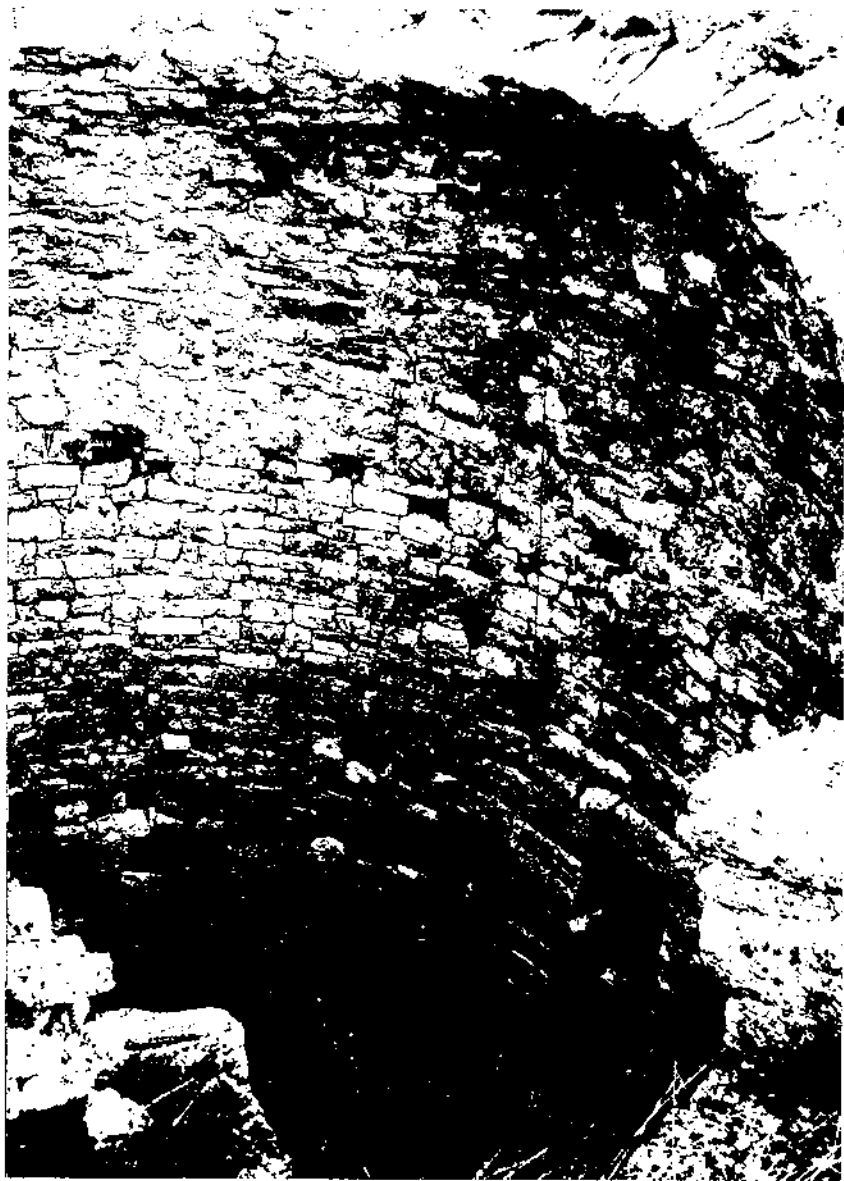
Parament interior del pou de glaç del castell de Ramonet (foto arxiu Joan Virella - 1974).