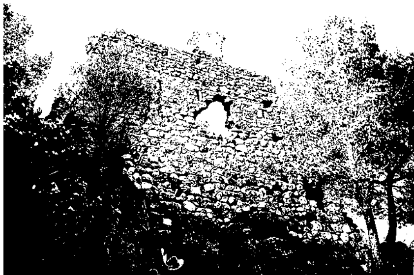
Torre de planta circular del castell de Pinyana.

Els Cervelló, de tota manera, continuaren essent barons de Querol, ja que retingueren el domini i la possessió d'aquell terme, com també mantingueren encara diverses propietats a Montagut com a alous. Per exemple, hi ha un document que porta la data de 1459 i que consisteix en un rebut fet pel dret de lluïsmo reial, signat amb la conformitat del batlle general a la venda feta per Guerau Alemany de Cervelló d'un censal mort a Bernat Çapila. L'interès d'aquest rebut ve donat pel fet que el noble s'obligà a la venda amb tots els drets i rendes que pertanyien al castell i terme de Montagut, fent constar que el tenia com a feu reial i sota domini i alou. És a dir, els Cervelló seguien essent senyors territorials, encara que empobrits. (53)