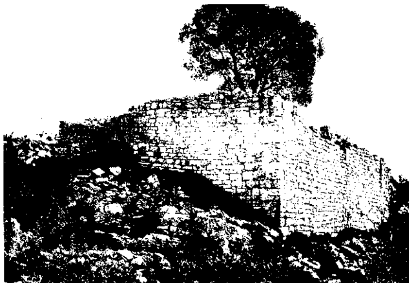
Dins el terme del castell de Montagut era inclòs, originàriament, el castell o casa forta de Ramonet, del qual encara es conserven restes molt apreciades d'una sala de planta rectangular.

Guillem II participà al setge de València el 1238, on jurà els tractats de capitulació. Assistí a les Corts catalanes del 1251. A les