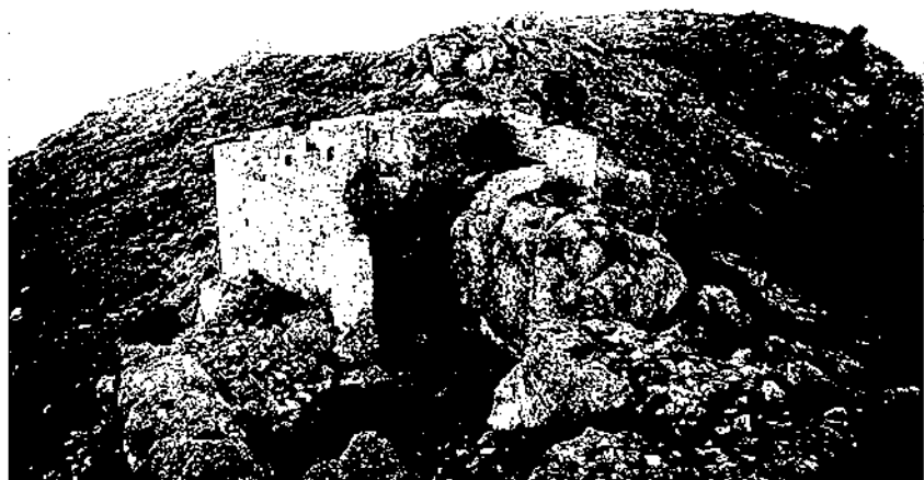
Petita estructura del sector sud del conjunt de fortificacions que defensaven l'entrada del castell de Selmella.