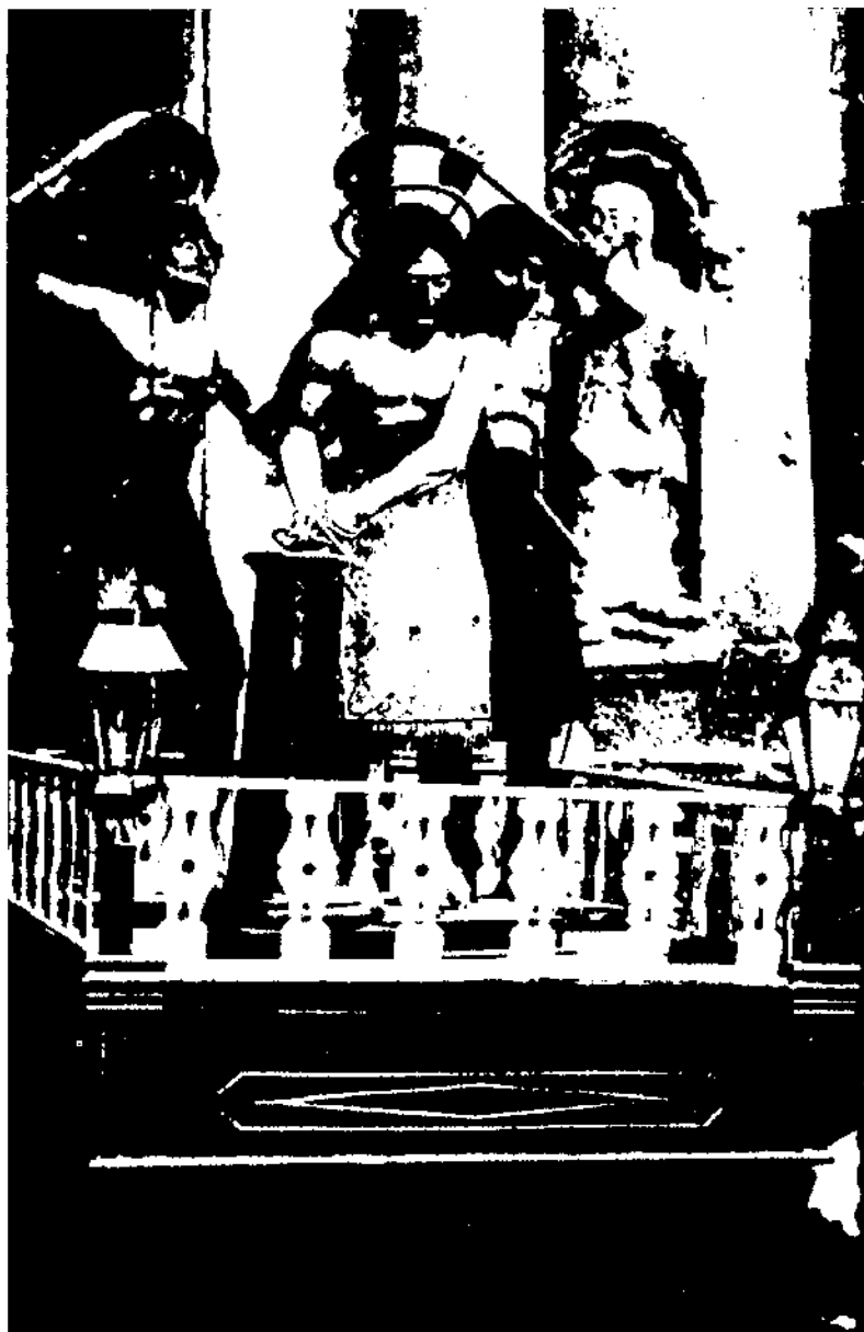
Conjunt del Misteri de l'Assotament, o també «Misteri de cal Galofre», adquirit per la Confraria de Sant Gregori l'any 1817.