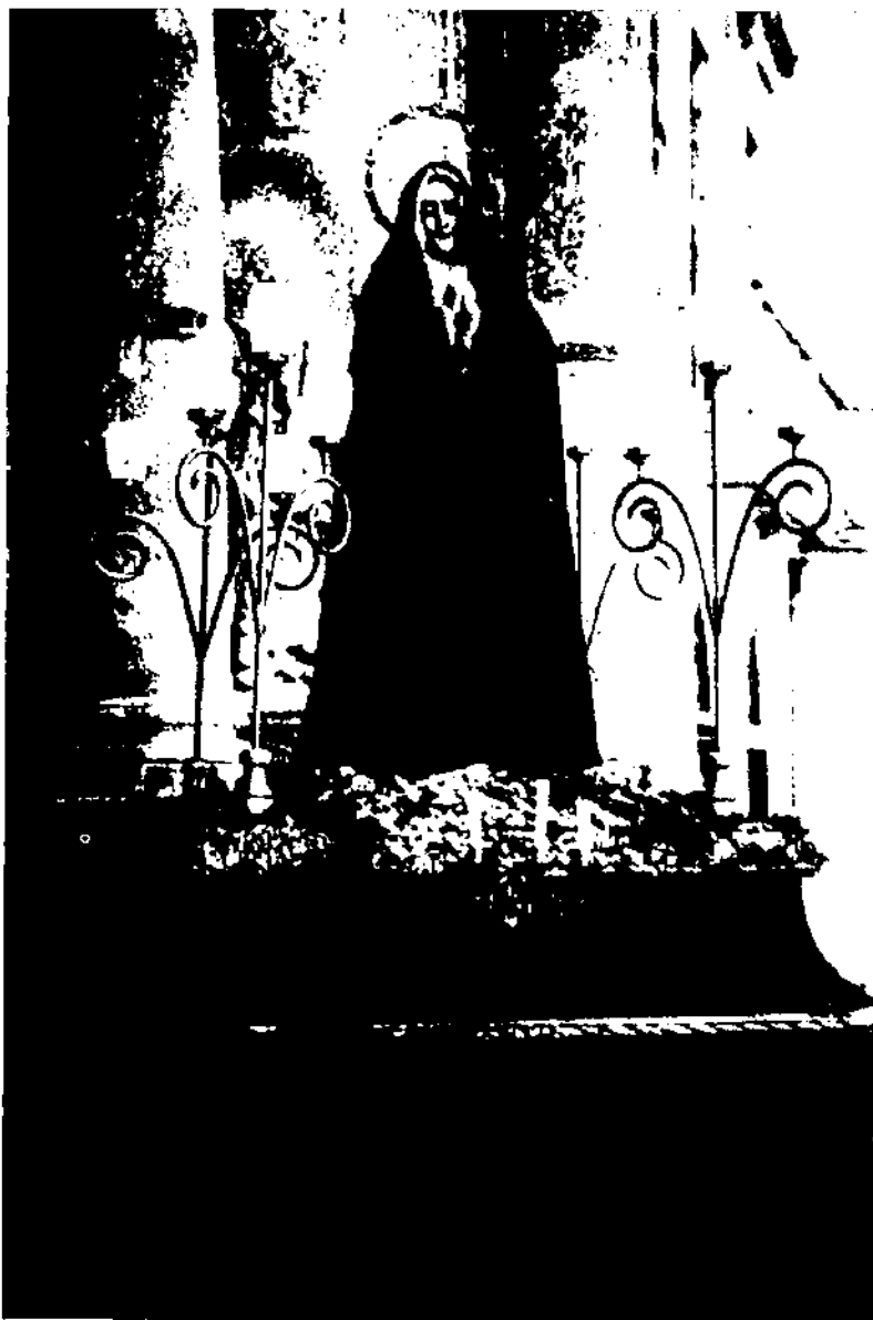
Misteri de la Soledat, que tancara l'antiga processó del Dijous Sant. La imatge fou adquirida per la Confraria de la Minerva l'any 1791. Per tradició, en tenien cura els pagesos i propietaris rurals.