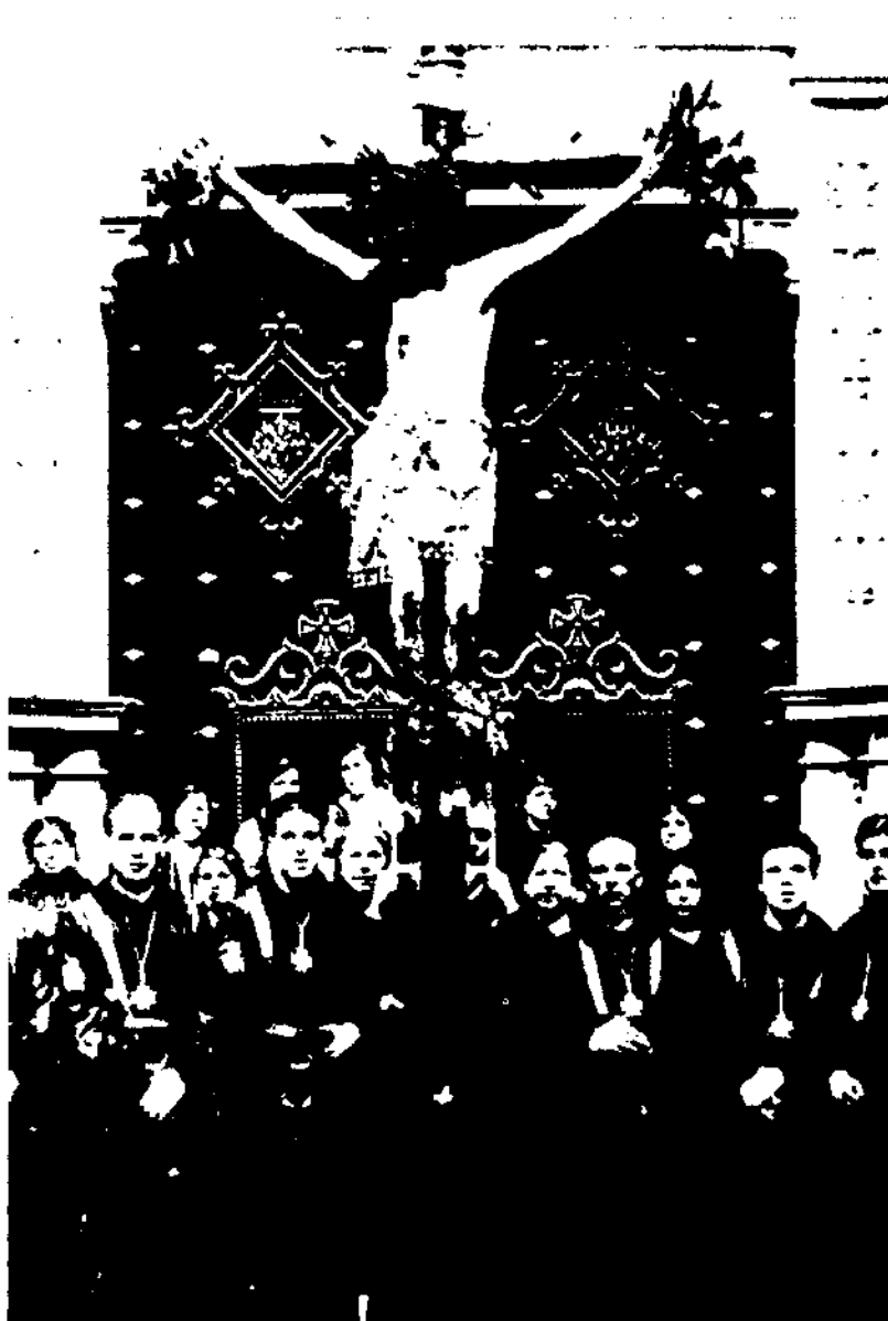
La imatge del Sant Crist adquirida per la Confraria de la Minerva l'any 1784. La fotografia ens mostra el Crist a Montserrat amb motiu del primer romiatge de l'arxiprestat del Vendrell l'any 1930.