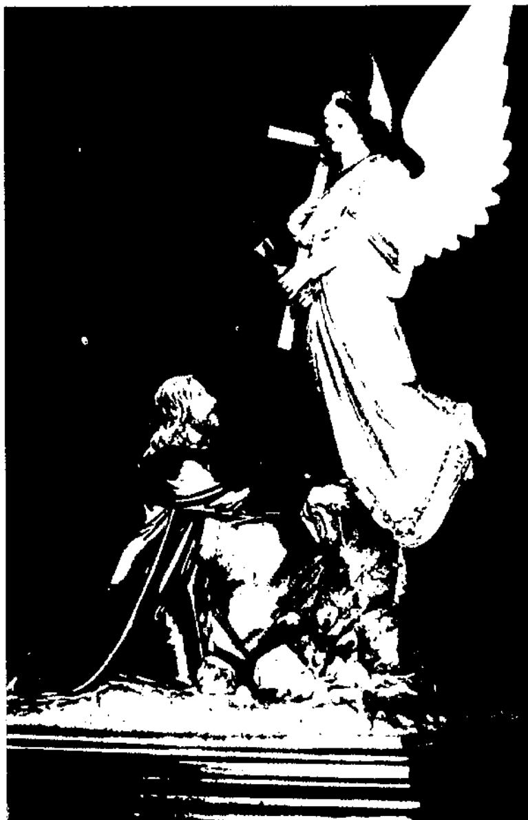
Conjunt de les imatges del Misteri de l'Oració a l'Hort, més conegut pel «Misteri de cal Magre» per haver estat adquirit i conservat per la família Bassa, coneguda amb aquest renom ja des del segle XVIII.