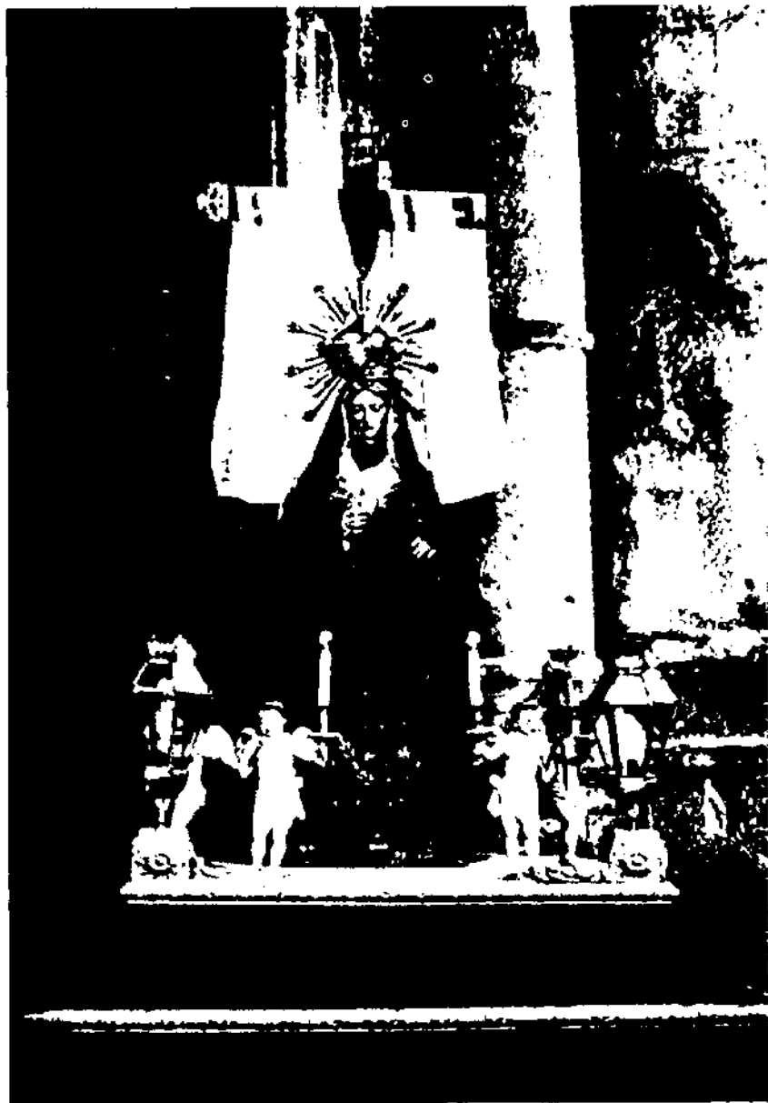
Imatge de la Mare de Déu dels Dolors del Misteri de Setmana Santa. Adquirida el 1850 per la Confraria en substitució de l'anterior del 1784.