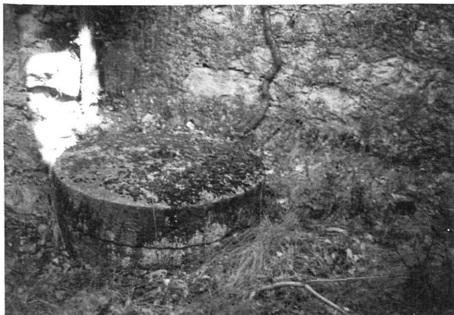
Pedres del molí de Dalt de Cal Mas (segle XVIII)