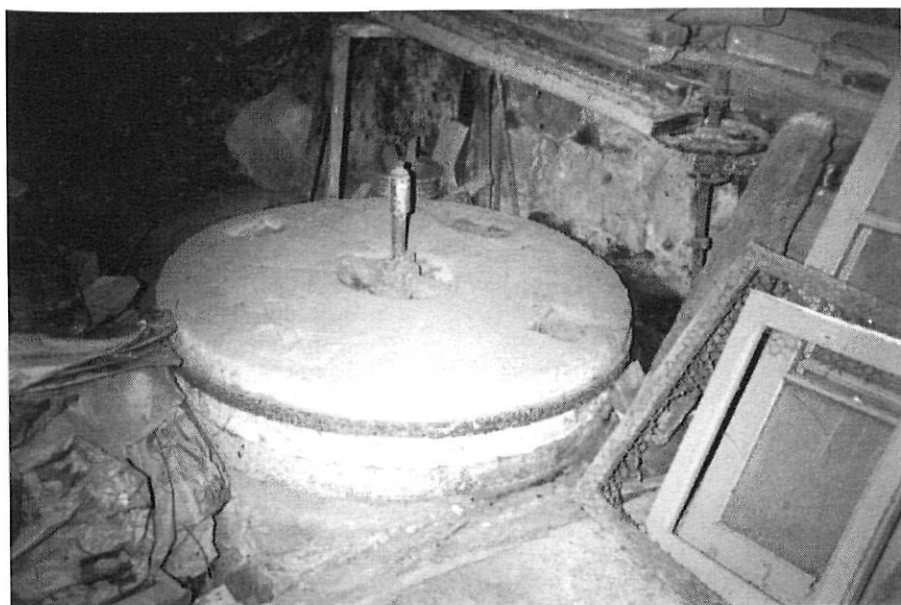
Pedres del Molí d'Enfesta (segle XVIII)