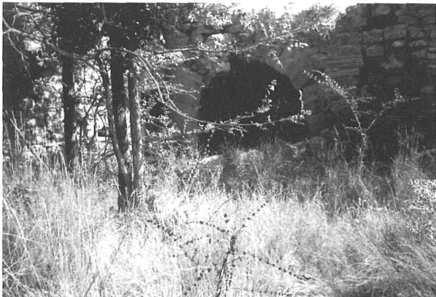
Restes del molí de Torremiñja (segle XIV)

A la masia de Torremiñja, a més del rastre del molí, s'hi conserven precàriament la pallissa, el graner, el forn de pa, els cups, celler amb bótes i una premsa de fusta, amb la data de l'any 1748 gravada en el dau, però les dues primeres xifres són separades de les segones per l'anagrama JHS.