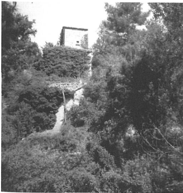
Esglaonat dels molins de Dalt i de Baix de Boixadors (segle XIV)