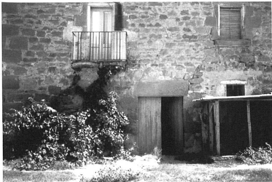
Portal del Molí d'Enfesta (segle XVII)