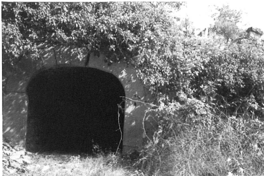
Molí de Baix de Cal Mas (segle XVIII)