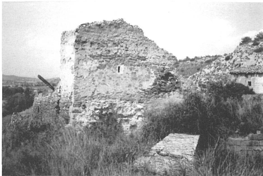
Restes del molí del Priorat (segle XIV)

Des de principis del segle actual el molí es troba enrunat i en l'actualitat encara són dretes algunes parets exteriors i els murs de la bassa. La sèquia molinera de Santa Maria també era utilitzada per a regar les hortes.