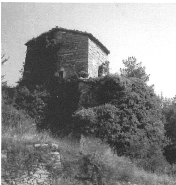
Casal del Molí de Dalt de Boixadors (segle XIV)