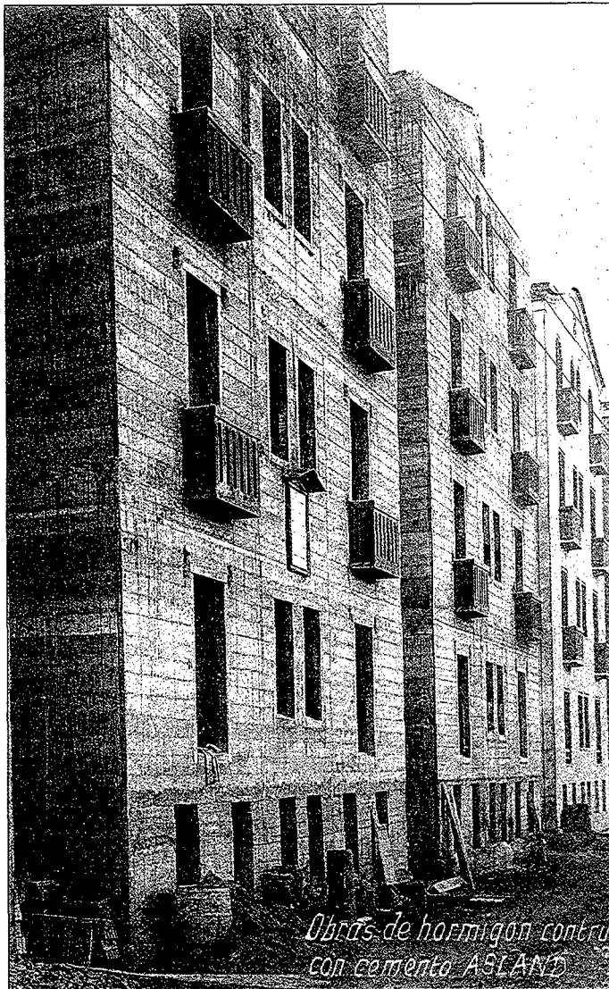
Façana principal a mig acabar (1924) dels habitatges per obrers de la fàbrica Bertrand de Sant Feliu de Llobregat, projectats per Borrell l'any 1922.

d'encarar amb els propietaris de les finques en el moment d'assenyalar les alineacions dels edificis que es volien construir en el sector que hem conegut com el segon eixample modern de Sant Joan Despí, per tal que s'adaptessin a la normativa urbanística. Sobre aquestes qüestions les tensions foren importants. També hem comprovat com sovint l'Ajuntament prenia acords tot convocant-lo per demanar-li informes sobre el desenvolupament de la construcció del Mercat Municipal (1906), de les obres de defensa del riu Llobregat al pas pel terme municipal (1908) o bé el cas de l'adequació de l'escala i del camí fins a l'estació del ferrocarril (1910).