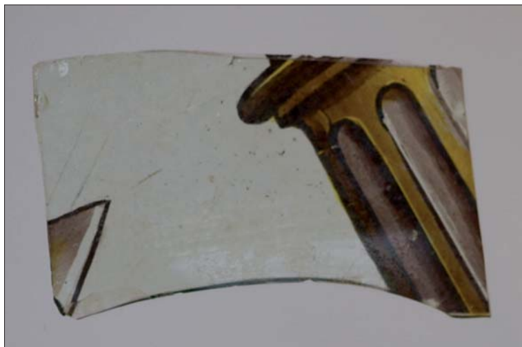
Figura 4. Fragmento de vidriera de la Sala de Dos Hermanas.