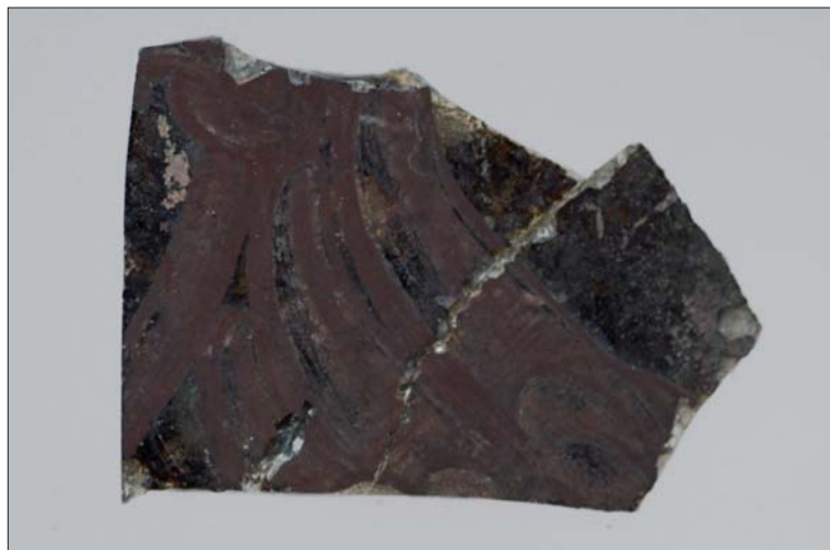
Figura 6. Fragmento de vidriera "Ala"