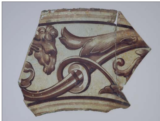
Figura 5. Fragmento de vidriera con cabeza de caballo y grutesco

Leones, quebró y derribó todas las vidrieras e otras que estaban en el cuarto de la dicha iglesia, que las unas y las otras eran de mucho prescjo por estar pintadas con muchas historias y armas reales» 106 .