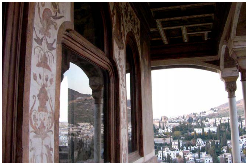
Figura 2. Peinador de la Reina