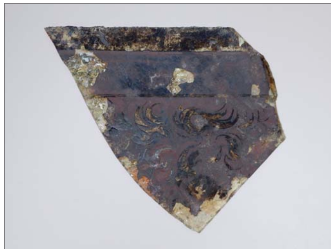
Figura 7. Fragmento de vidriera con penacho