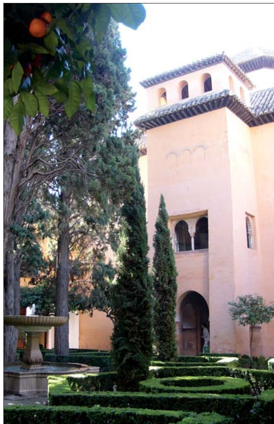
Figura 3. Mirador de Lindaraja