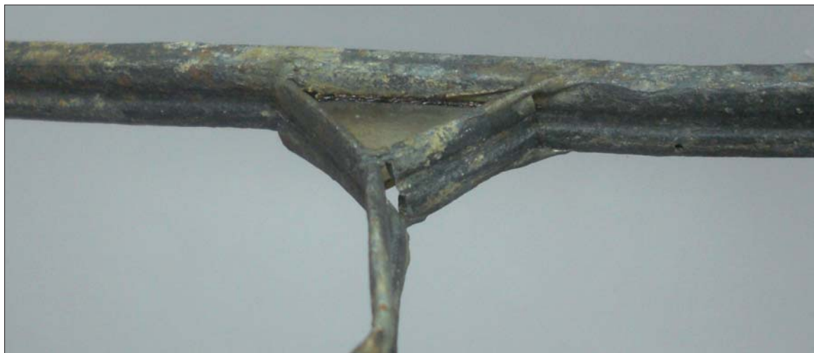
Figura 8. Perfil emplomado

al museo en 1 de enero de 1943, cuando se incorporó el museo al cuerpo facultativo.