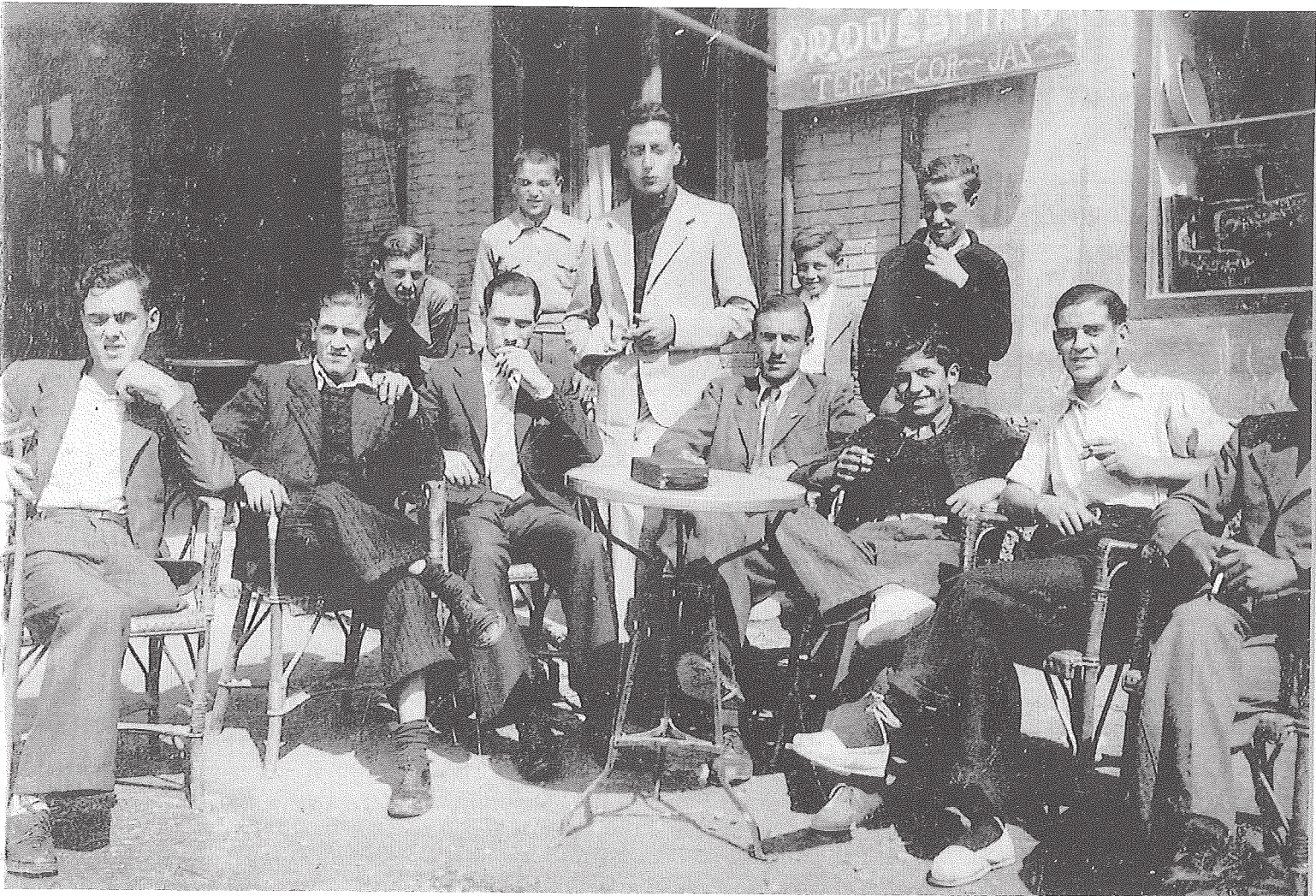
La terrassa del cafè fonda Orient probablement just acabada la Guerra Civil. El cartell anuncia l'actuació de la Terpsícor Jazz a la sala de ball d'aquest cafè