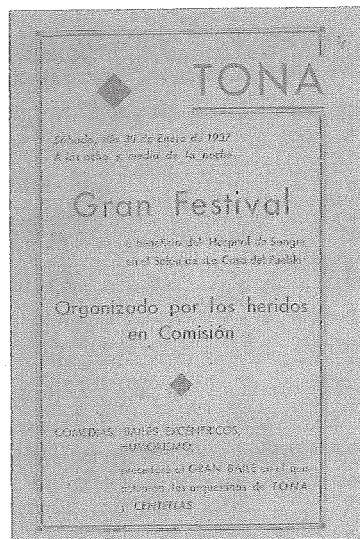
Dos programes que anuncien l'actuació de l'orquestrina: per l'Aplec de la Rosa del 1936 a dalt el Castell; i durant la Guerra Civil, el 1937, en un ball a benefici de l'hospital de sang