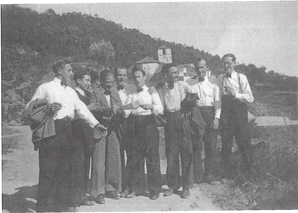
Els músics de la Terpsicor Jazz als anys quaranta, en un poble no identificat