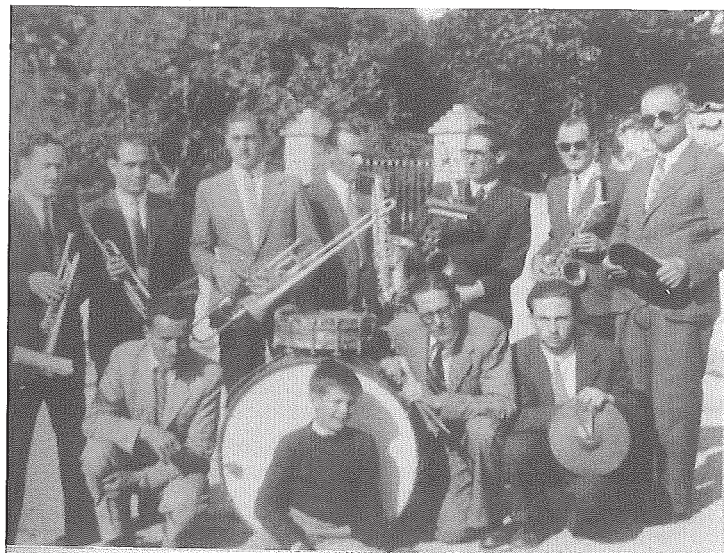
Dues imatges dels components de l'orquestrina Terpsícor Jazz als anys quaranta. La primera foto és de l'any 1944 o 1945