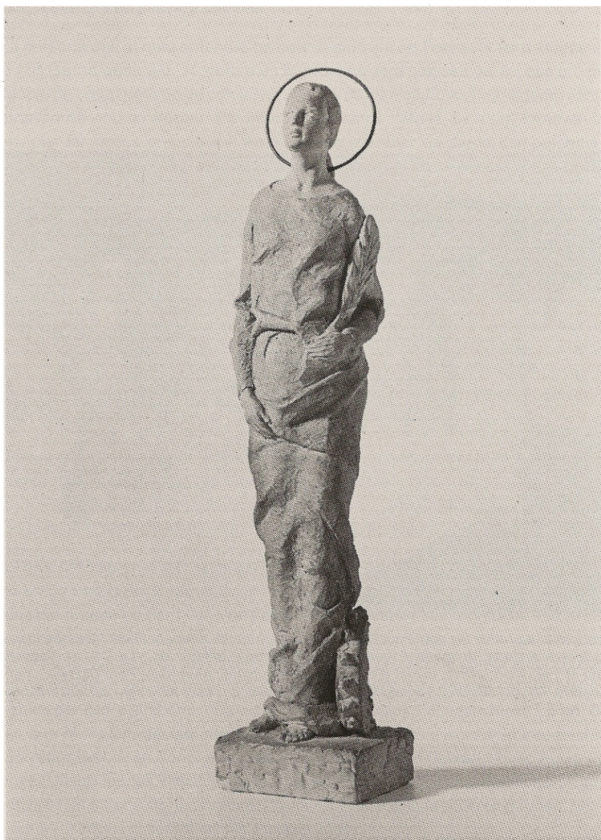
SANTA CATERINA Argila cuita acolorida. Firmada i datada l'any 1953. (Fotografia: J. Casadellà).