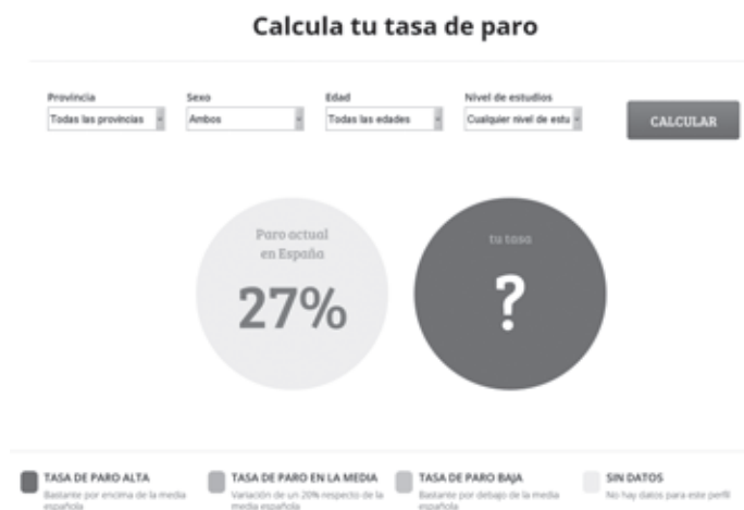
Figura 6. «Tu tasa de paro»

jecte Qué hacen los Diputados 32 . Des de juny de 2011, segueixen al dia l'activitat parlamentària. «Existeix molta informació disponible sobre els diputats però és difícil de trobar, entendre i interpretar. Vam pensar que podríem fer servir les eines digitals per monitoritzar la tasca dels polítics. Volem ajudar a millorar la transparència», expliquen des de la seva pàgina. Actualment, a través de crowdfunding , han aconseguit diners per construir una eina que permeti a moltes mans actualitzar diàriament la informació del Congrés dels Diputats.