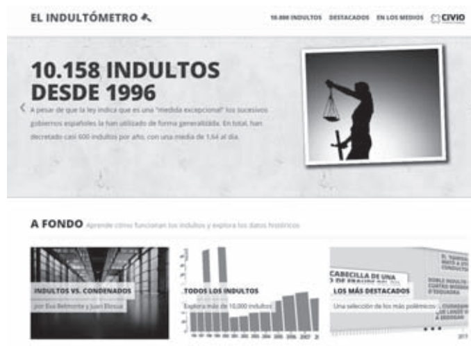
Figura 5. «El indultómetro»

que cal destacar és Espanya en llamas 29 , que permet visualitzar bona part dels 187 mil incendis que han cremat més d'un milió d'hectàrees a Espanya durant una dècada (2001 -2011).