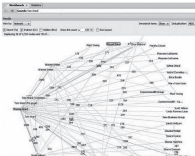
Figura 3. Offshore Leaks , xarxa de contactes en el món dels paradisos fiscals

relacions i les seves milionàries transaccions de diners al llarg dels anys.