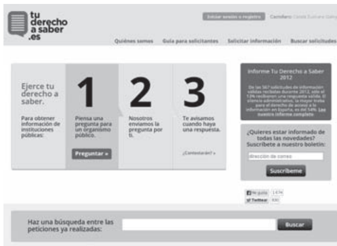
Figura 4. «Tu derecho a saber»

plicades, el projecte continua endavant amb força. «En els últims mesos, sembla que els ajuntaments vulguin obrir les seves dades, però els formats en els quals les publiquen (PDF), les converteixen en documents inútils», va explicar Eva Belmonte a les Jornades.