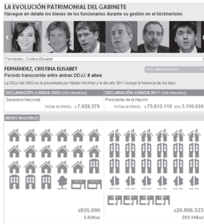
Figura 1. La Nación , «La evolución patrimonial del gabinete»

Sense deixar el continent americà, no podem deixar de parlar del ric moviment de periodisme de dades a l'Amèrica Llatina. Aquí cal destacar el diari argentí La Nación , que s'ha convertit amb el blog « Data » 13 en un dels mitjans capdavanters del moviment a nivell mundial. El seu equip de dades ha dut a terme reportatges tan rellevants com « La evolución patrimonial del Gabinete » 14 , que mostra l'evolució al llarg dels anys del patrimoni de membres del govern i alts càrrecs.