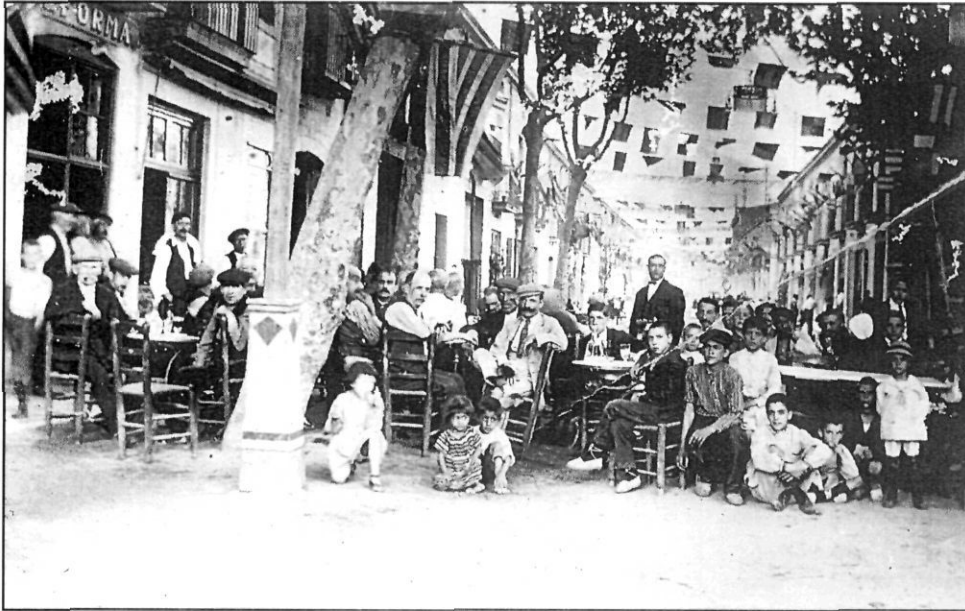
Serenata a l'Havana, a l'altura del bar La Reforma (1923).

casa que tenen al carrer d'en Moles com a possible lloc per establir-hi el teatre, però aquest projecte no s'arribarà a posar mai en pràctica.