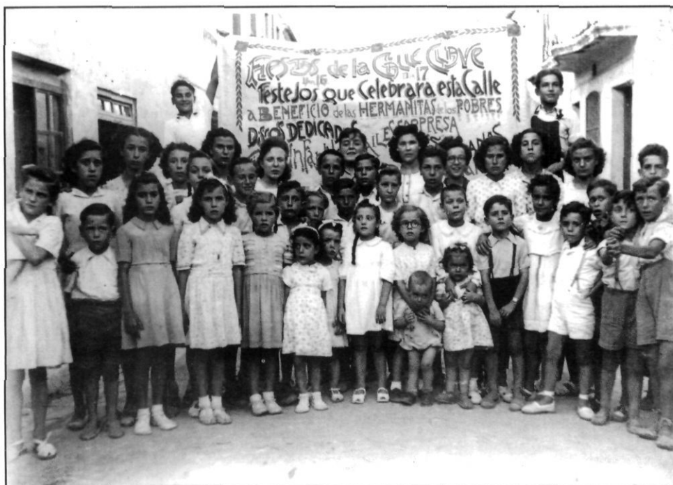
La mainada del carrer Clavé (Camí fondo) a la serenata celebrada els dies 16 i 17 de juny de 1945.

fanalets de color y un barco que penjaba al centre i il·luminaven llumets posats en closcas de cargols.» 9