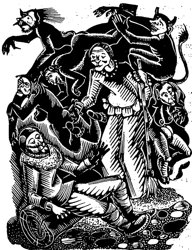
Il·lustració de la llegenda La pinta de la bruixa . Xilografia d'Antoni Gelabert, del llibre La Xarbotada , de Jaume Clavell i Nogueras.

Al llarg dels temps i de la història, el Dimoni apareix amb diversitat de formes. En el culte demoníac adoptà la imatge del mascle cabrit, sempre relacionat amb tot allò que és infecte i sexual. Aquesta