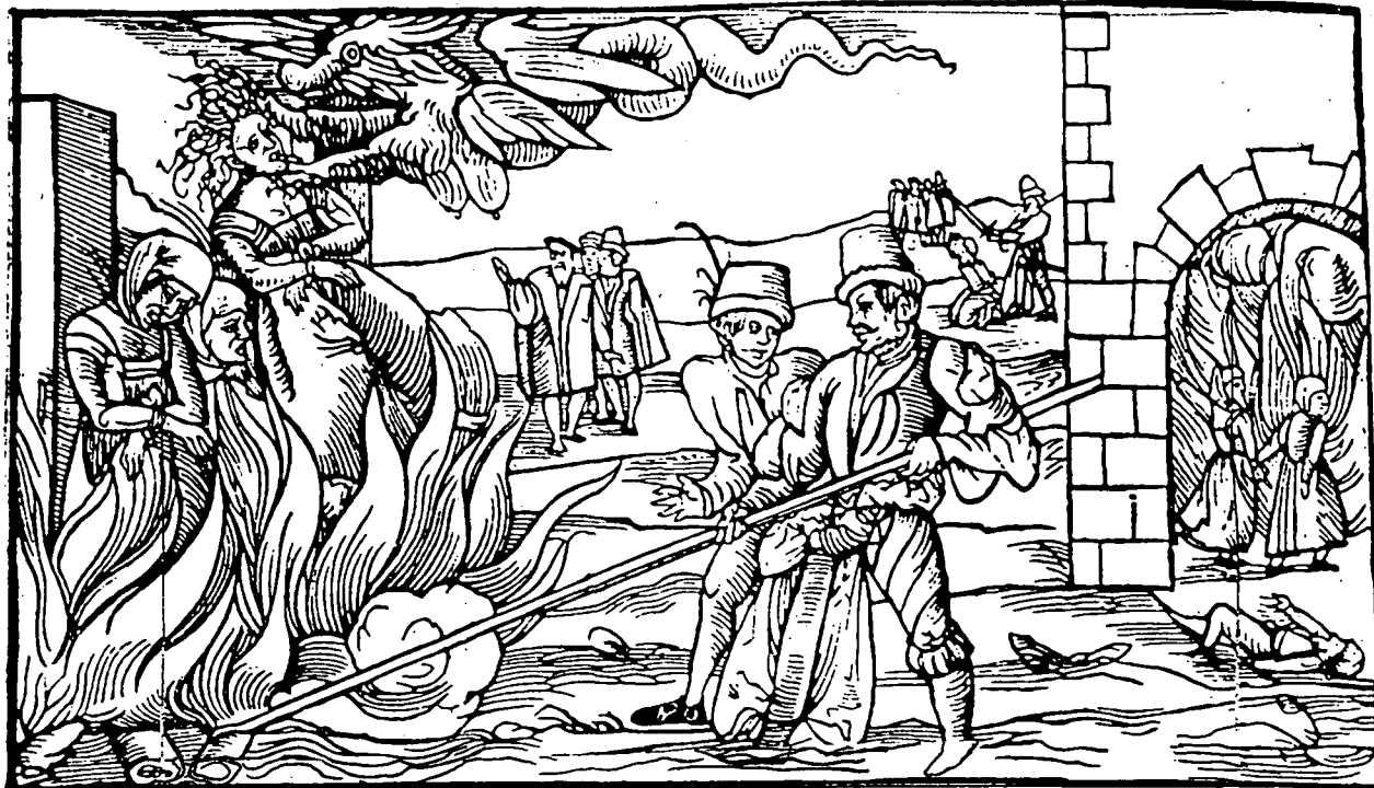
Crema de bruixes al segle XVI, segons un gravat alemany.

schafft Heimleyn am Harz gelegen von dreien Zauberin vmb zwanzen Männern Merlichen ragen des Monats Octobris Im 1555. Jare ergangen ist.