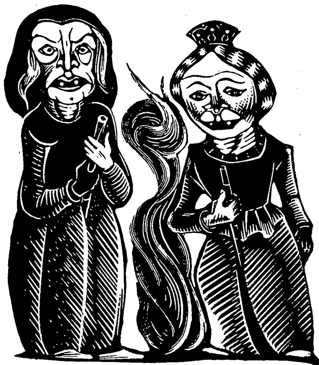
Bruixes de Burriac. Xilografia d'Antoni Gelabert, del llibre La Xarbotada , de Jaume Clavell i Nogueras.

Les bruixes se miraren estranyades y després d'una petita pausa, enlayrant les escombres màgiques, tornaren á cridar: