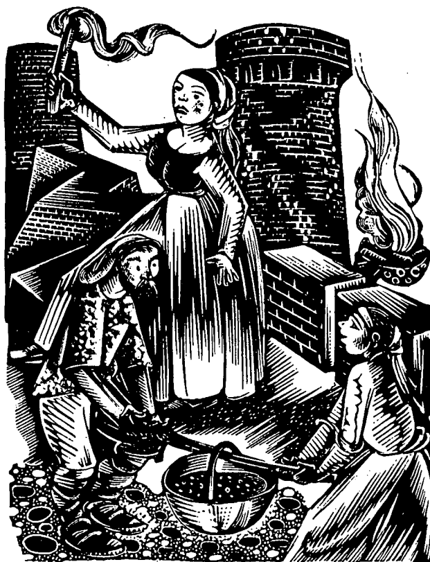
Il·lustració de la llegenda L'enginy de la castlana . Xilografia d'Antoni Gelabert, del llibre La Xarbotada , de Jaume Clavell i Nogueras.

Per les boyrades ressonaven estranys burgits, semblants als de millers d'axáms d'abelles que s'acostessin impulsades per