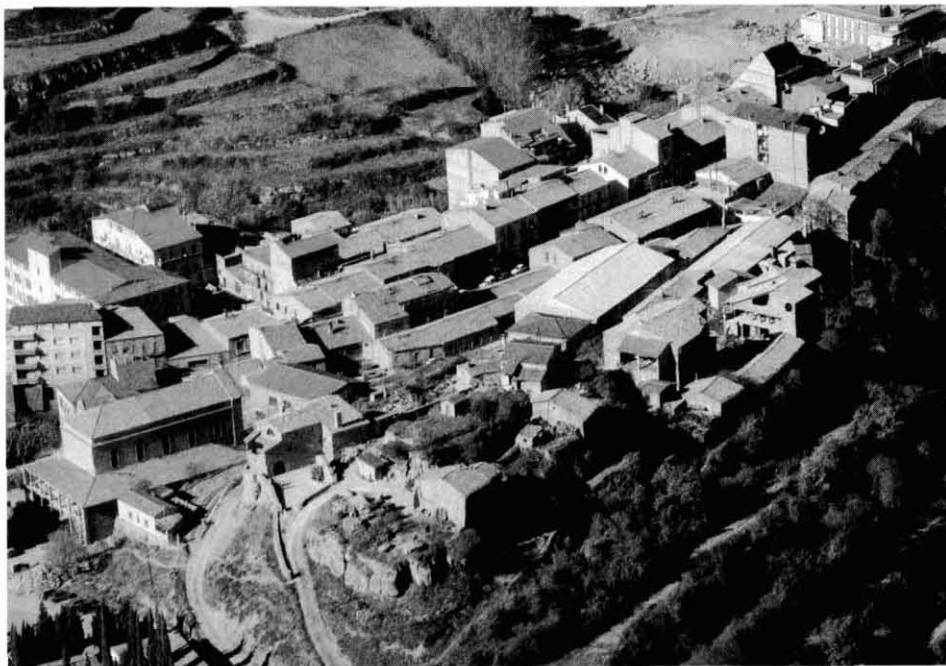
Fotografia del castell de Puig-reig en una imatge de començaments del segle XX conservada a l'Institut Amatller d'Art Hispànic que conserva els fons de l'Arxiu Mas.