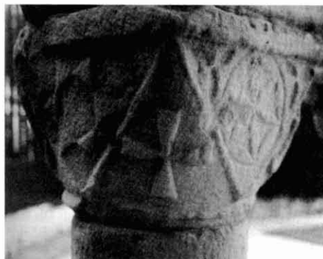
La rosa i la creu patents són els símbols de l'orde del Temple.