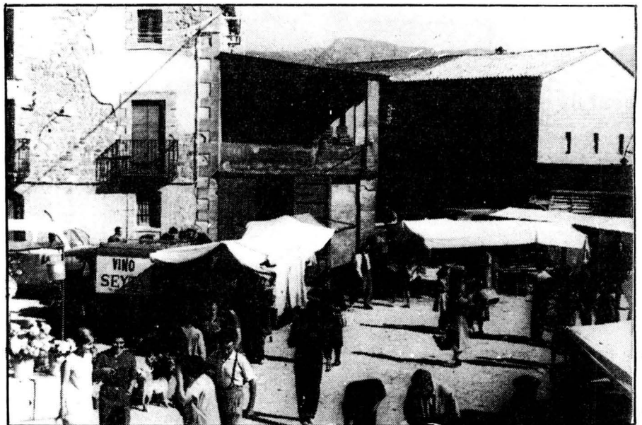
El mercat de Montmajor, focus d'intercanvi econòmic i social