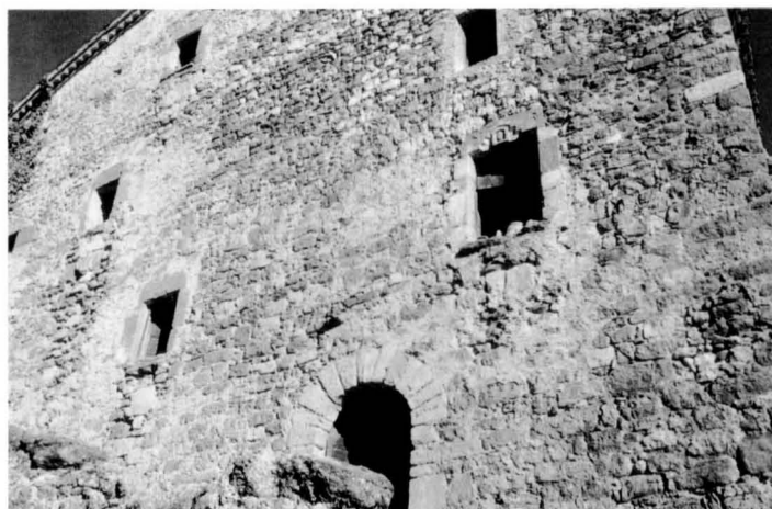
A mitjan segle XVI la família cognominada Viladomar i Sant Miquel es traslladà des de Sant Miquel a l'espectacular masia de Corrubies, intacta durant segles fins a quedar afectada pels incendis de l'estiu de 1994.