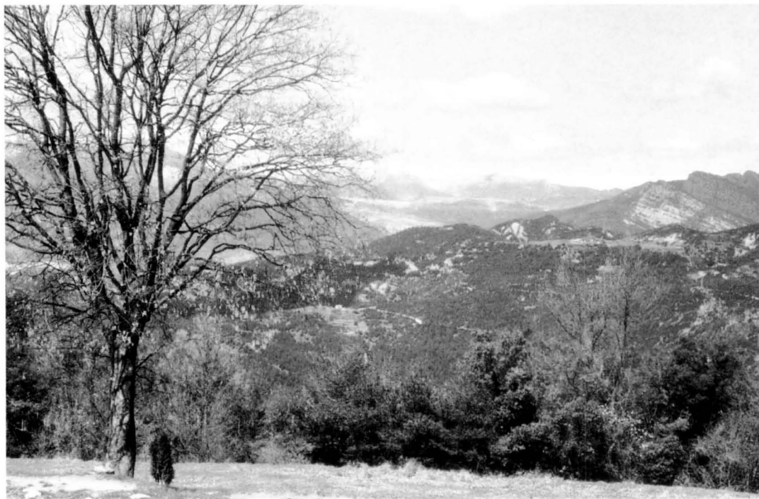
Les Canals de Sant Miquel i la Gotzera al fons, des de Campdeparets.