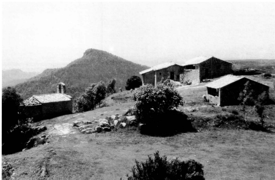
A la casa de Sant Miquel de les Canals, situada al costat de l'oratori que li dóna nom, va néixer cap al primer terç del segle XVI Antoni Viladomar. JOAN SERRA (1989).

revitalitzador de la Portella i puntal d'una nissaga.