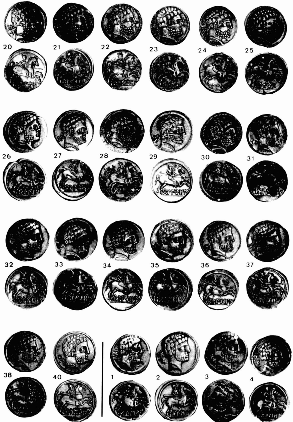
Fig. 3 — Números 20 a 40, denarios de Belgio, y números 1 a 4, denarios de Boscana. (Tamaño natural.)