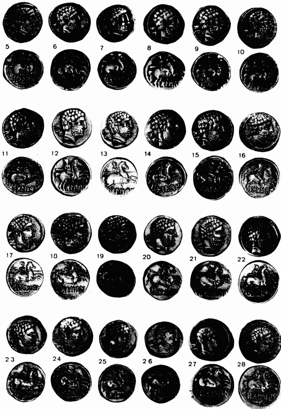
Fig. 4. — Denarios de Bolscan. (Tamaño natural.)