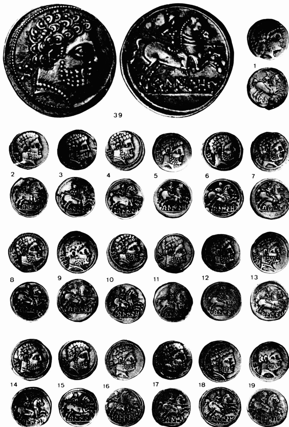
Fig. 2. — Denarios de Belgio. El n.º 39 está ampliado a tres veces su tamaño, los demás se presentan a tamaño natural.