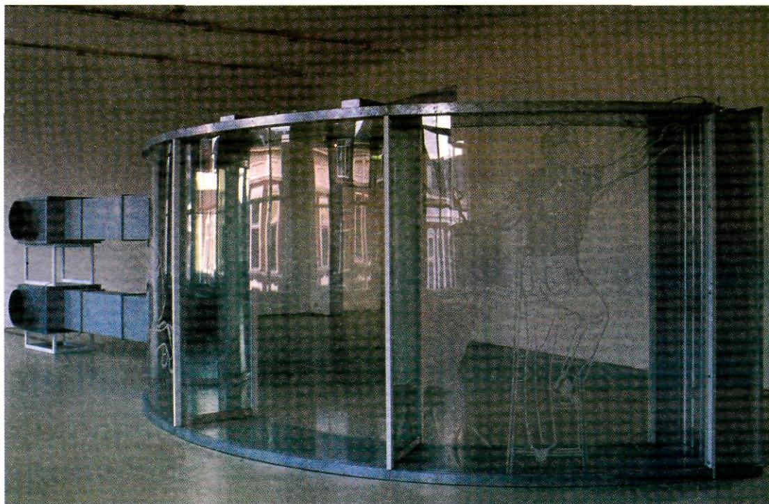
Untitled (Wind Machine) , de Tony Brown, a l'exposició Downtime , de 1996.

veure les coses bastant diferent, que després et dona una major capacitat de comprensió.