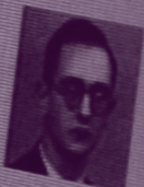
Amat-Piniella, Joaquim (1913 - 1974)