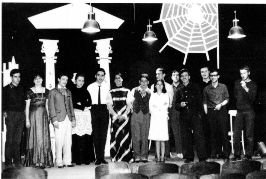
Grup Art Viu.

Separant-se del teatre de varietats i del repertori tradicional enllaçat amb els èxits de sempre, alguns ja des d'abans de la guerra (Terra Baixa, Els Pastorets...), el teatre manresà va canviar sobretot als anys seixanta en el grup Art Viu, amb autors com Espriu, Ionesco, Txèkhov o Brecht. L'autor de l'article, com a espectador primer i aviat com a col·laborador, va viure de prop bona part del teatre d'aquells anys. Aquí fa memòria d'aquest art que –com diu– suma components de molts altres: plàstica, expressió corporal, paraula, espai, ritme i música.