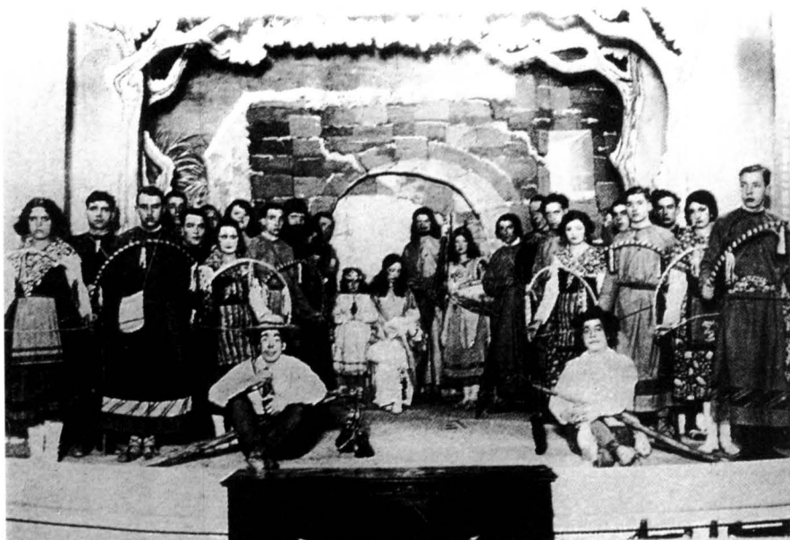
El grup escènic de la Joventut Carlista, a Els Carlins, a punt per a una representació d' Els Pastorets , l'any 1932.

Tot i que no en tinc una vivència tan directa, a la plaça Major, i en altres indrets de la ciutat, o en teatres, o a l'aire lliure, s'han vist altres espectacles i esdeveniments teatrals importants, dignes de recordar. Tanmateix, tot plegat ja forma part de la nostra història. La vida segueix: malauradament per tot el que és negatiu, però benaurat també per a tantes coses humanament positives. En aquest moment, el fil del bon teatre em porta als cicles de tardor i de primavera de Faig Teatre al Globus. A la tasca important de la gent d'El Galliner, que ens porten activitats teatrals i espectacles de qualitat i d'actualitat; i a les visites que organitza l'Òmnium Cul-