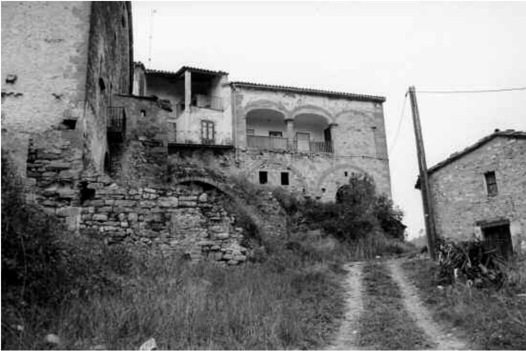
Vista general de Claret dels Cavallers. Al centre can Serra