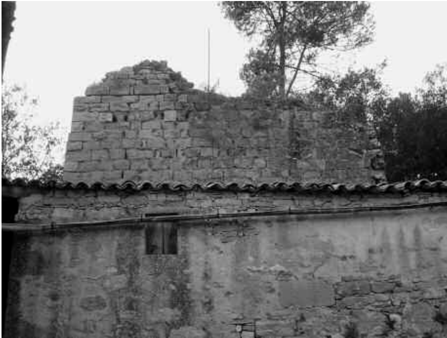
El castell de Claret dels Cavallers

que la frontera sud no era a la carena de la serra de Castelltallat, sinó al fons de la vall, per on passa la rasa d'Utgés. Des d'antic els comtes de Barcelona tenien possessions allà, singularment el mas Codony que és molt a prop de Claret dels Cavallers 4 , gairebé al fons de la vall, al marge dret de la rasa d'Utgés. Podria ser que Claret dels Cavallers fos un dels castells de la Cerdanya, situat al marge esquerre de la rasa d'Utgés, sobre la línia fronterera amb el comtat de Barcelona. Ara, el fet que Coaner fos del bisbat d'Urgell i Claret fos del de Vic, així com la seva proximitat a Codony, ens fa sospitar que potser Claret no era el castell més avançat al sud del comtat de Cerdanya sinó el situat més al nord del comtat de Barcelona. En canvi, el castell veí de Coaner sí que era del comtat de Cerdanya. En qualsevol dels dos casos, això li donava una importància estratègica excepcional. Fins a l'any 1117, quan el comtat de Cerdanya s'integrà al de Barcelona, les relacions entre ambdós comtats no foren gens cordials.