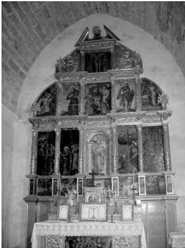
El retaule de Sant Pere de Claret dels Cavallers

col està ocupat a la seva part central per l'altar que presenta una taula frontal pintada, amb la imatge de la càtedra de Sant Pere. Després hi ha la grada amb el sagrari al mig. Els laterals del sòcol són llisos. El cos inferior, la predel·la o bancal, conté 5 carrers ocupats per taules quadrades, flanquejades per 6 petits pilars rectangulars amb imatges de diversos sants. D'esquerra a dreta, el primer carrer conté una pintura de l'arcàngel Sant Miquel enviant un dimoni a l'infern, el segon conté l'àngel de la guarda donant la mà a un infant en actitud de caminar, el tercer –el central– conté una pintura del Sant Sudari flanquejat de dos àngels, el quart representa a Sant Sebastià i el cinquè carrer representa a Sant Bernardí de Siena.