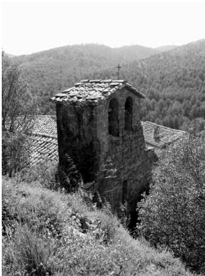
L'església de Sant Pere de Claret dels Cavallers

La volta és ogival, sense arcs, i feta amb carreus ben treballats. Sembla correspondre a un moment de transició entre l'últim gòtic i el renaixement, de forma que es podria situar en el segle XVI. La porta de la sagristia i les capelles laterals són cla-