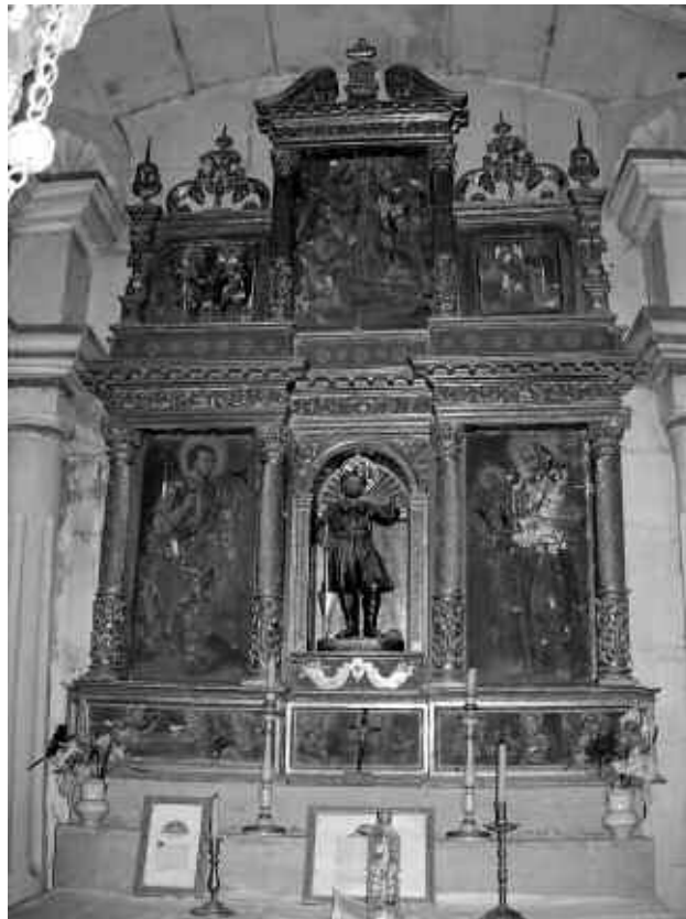
El retaule de Sant Isidre de Claret dels Cavallers.