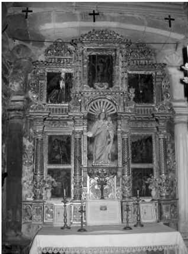
El retaule del Roser de Claret dels Cavallers

A la part inferior hi ha dos carrers a cada banda de la marededéu del Roser que representen escenes del naixement i la passió de Jesús. A l'inferior esquerre, es veu Jesús al palau de Pilat colpejat pels soldats romans. L'inferior dret mostra a Jesús lligat a la picota i fuetejat. El superior esquerre representa l'adoració dels pastors i el superior dret l'adoració dels Reis Mags. Quatre columnes acanallades, separen aquests espais. En mig, situada en un nínxol apertinat, hi ha l'estàtua de la Verge del Roser. La part superior del retaule conté tres carrers, el central una mica més alt que els laterals. El de l'esquerra representa un àngel, i al de la dreta es veu l'Esperit Sant en forma de colom,