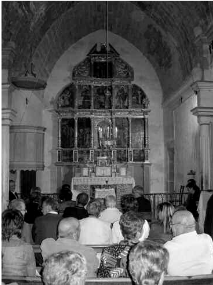
Des de l'any 2006 s'ha recuperat el culte a Sant Pere. Cada any, per la festa del Roser, s'hi diu missa i s'hi fa una xerrada sobre història local

Ribadeneyra diu: pues para nosotros, qué son las vidas de los Santos, sino un dechado, y un espejo, que debemos tener siempre delante de nuestros ojos, para mirar en él nuestras fealdades, y vicios, y enmendarlos, y las heroycas virtudes de ellos, para despertar nuestra tibieza, e imitarlos?