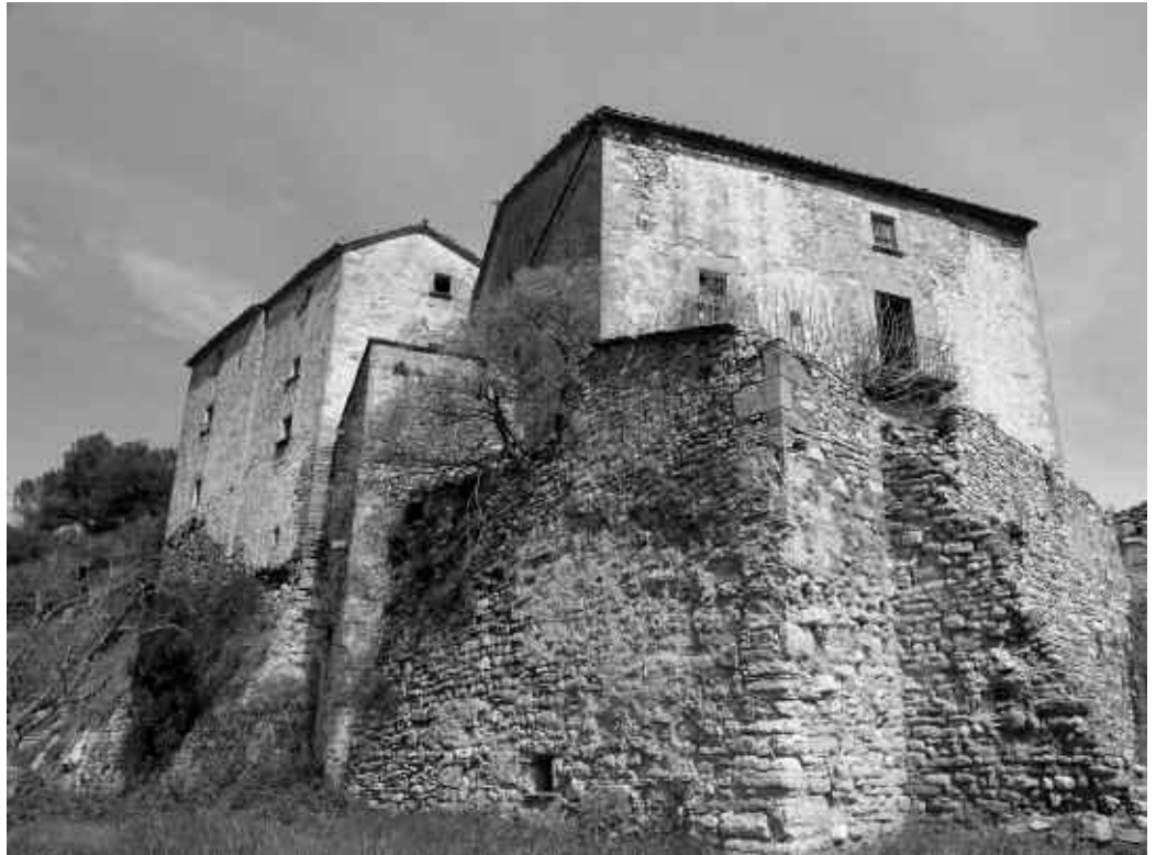
Vista general de Claret dels Cavallers. En primer terme can Ferrer