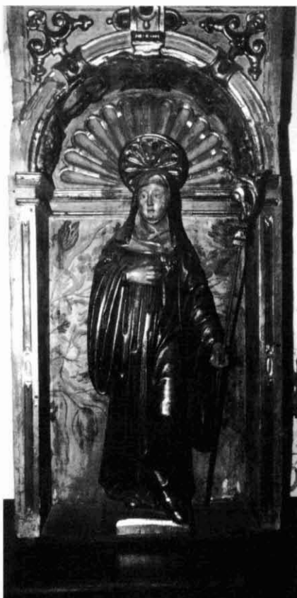
6. Santa Gertrudis.