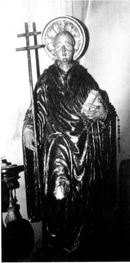
2. Sant Benet.