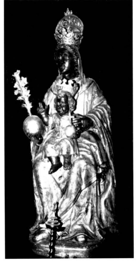
4. Mare de Déu de Montserrat.