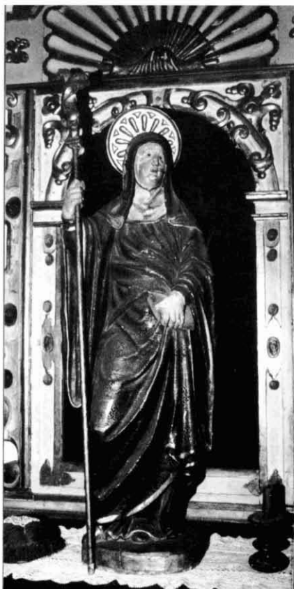
5. Santa Escolàstica.