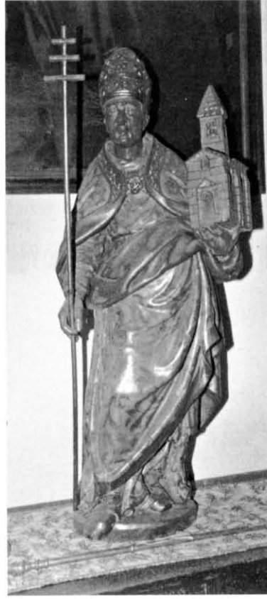
3. Sant Gregori el Gran.