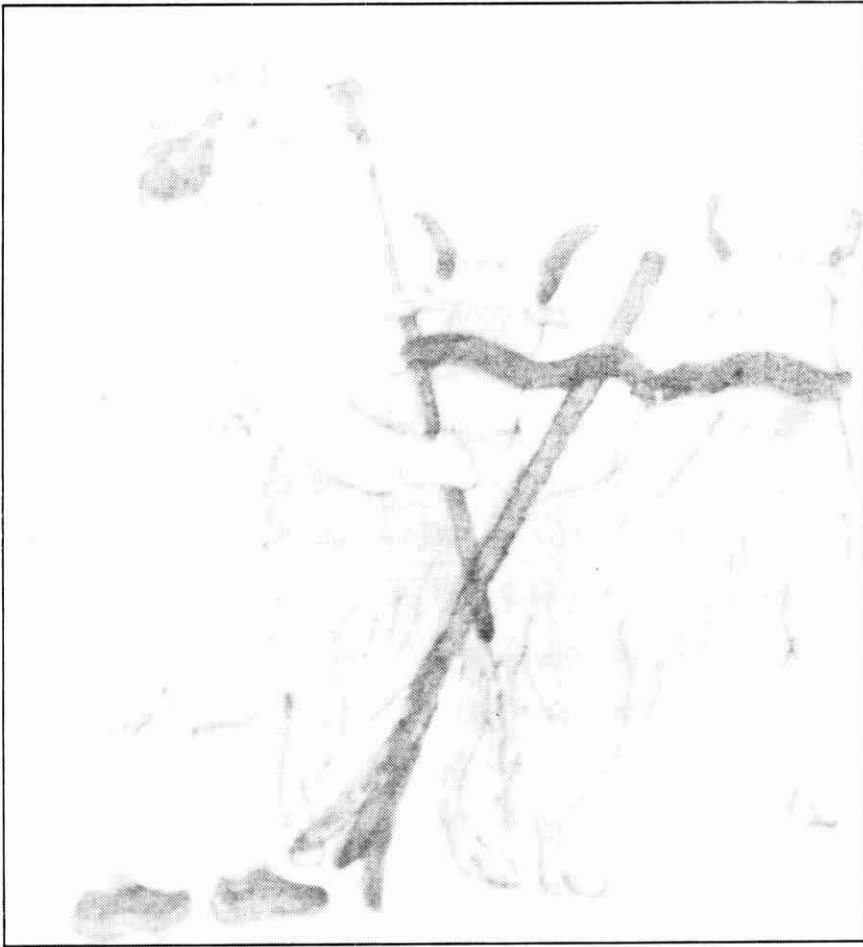
Ceràmica de miltats del segle XVIII que mostra un pagès amb l'arada tradicional o romana.

bens immobles (terres i/o cases). Aquestes compres les feien llauradors que tot i ser propietaris es veien obligats a endeutar-se per a millorar. Un exemple d'això és el de Martí Vinyes, pagès de La Baells, que crea un censal l'any 1792 de 206 lliures i un sou a favor de la Comunitat per a pagar unes terres que ha comprat (10).