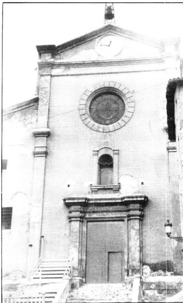
L'església de St. Pere de Berga relacionada, també, amb la funció prestamista de l'església (Arxiu Dovella).

El principal ingrés de l'estament eclesiàstic era el delme, que suposava més o menys una dècima part de la producció agrària bruta. La reper-