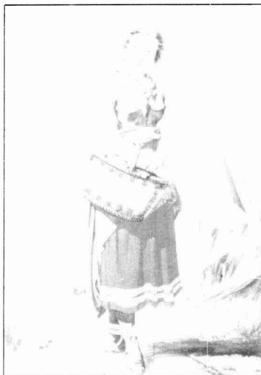
Indumentària típica de la gent de pagès a principis del segle XIX.