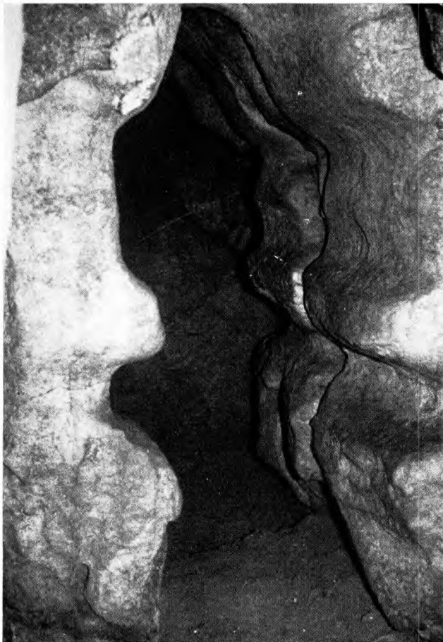
Vista de la Galeria principal de la cova "B" d'Olopte.

rineus Orientals i basant-se en els estils ceràmics i alguna data radiocarbònica baixa, ha suposat un retard arcaïtzant que arribaria quasi fins l'Època Romana (42). Els dos punts són bastant discutibles amb les dades que poseïm actualment: en primer lloc, no existeix una tònica particular de barroquisme decoratiu i gran part de la terrissa es llisa o amb ornamentació molt sumària, no donant peu a parlar d'uns tipus o motius exclusivament cerdanes. És veritat que certs temes són més utilitzats o preferits que d'altres —ungulacions, incisions en forma d'espiga, pastilles— però