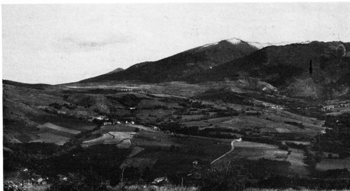
Panoràmica del Coll de la Perxa des del Castell de Llivia. Sobre la vall, la mole nevada del Cambras d'Ase i senyalat per la sageta el cim de Sant Feliu de Llo.