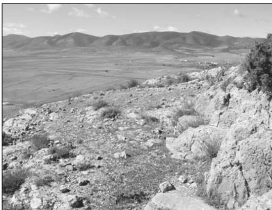
5. La Higuera (PDF-032). Vista de la terrassa per on s'estén el material ibèric, controlant el Campo de Bugéjar.