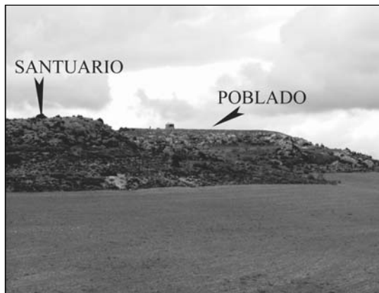
2. Cerro del Almendro (HCR-001). Situació del santuari en relació amb el poblat fortificat del mateix nom.