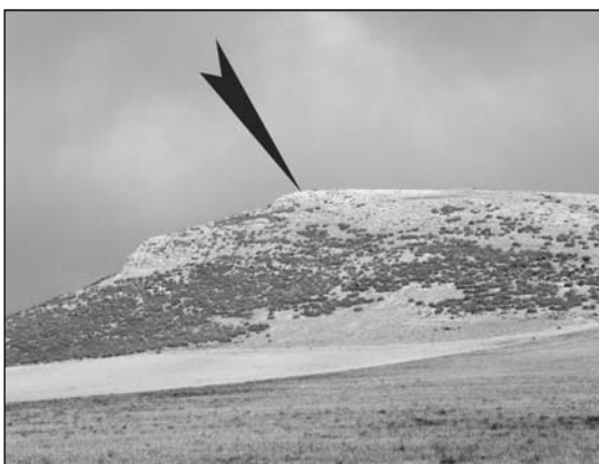
3. Cerro del Trigo (PDF-011). Vista del santuari territorial, situat en un turó al centre dels Llanos de Bugéjar.