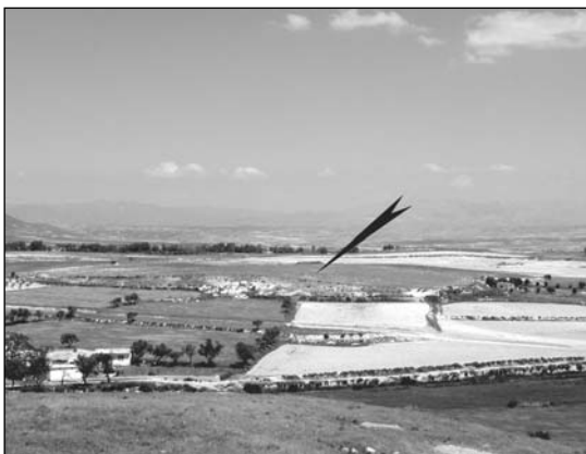
1. Cerro Largo 2 (BAZ-004). Vista aèria del santuari des de l'oppidum de Basti, inserit a la necròpolis del mateix nom (BAZ-003).