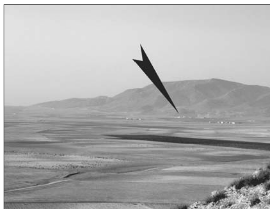
4. Cerro del Trigo (PDF-011). Visibilitat cap al sud-oest, on s'observa el santuari de Cerros del Curica (PDF-042).