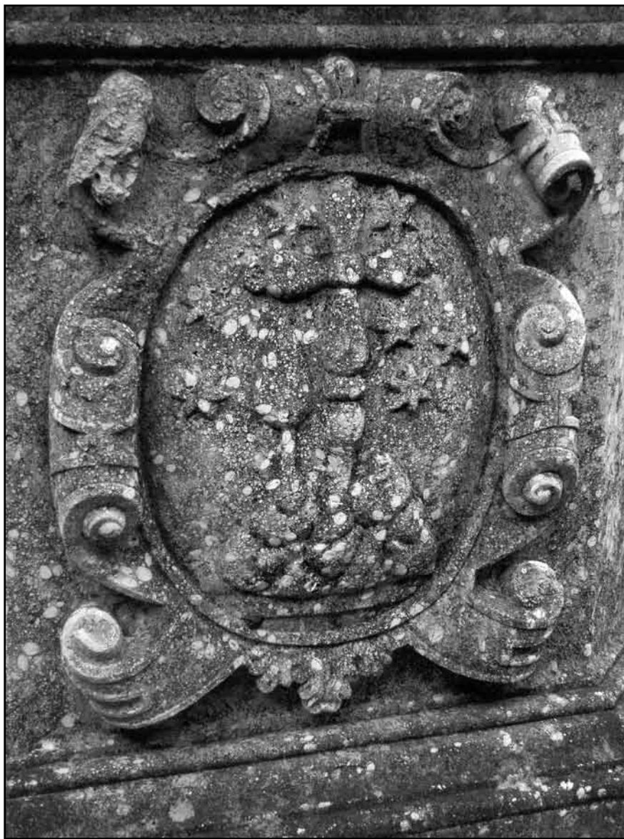
Escut esculpit al pou del claustre petit de la Cartoixa; conté dos turons, un amb una creu i l'altre amb un xiprer, tot envoltat pels set estels cartoixans. De datació incerta, podria ser de la fi del segle XV o del segle XVI. Actualment hi ha tendència a considerar que aquest és l'escut més autèntic i antic.