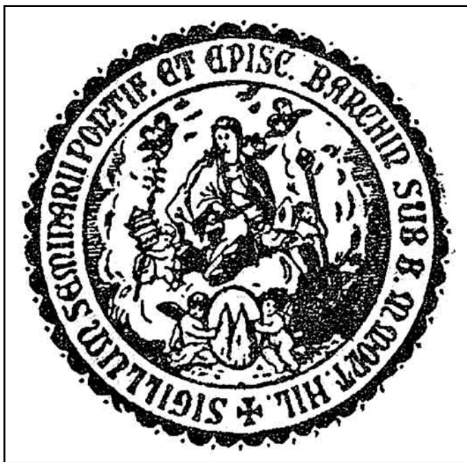
Segell del Seminari de Barcelona, tant del Major com del Menor, i que consta a la Guia del curs 1977-1978 del Seminari Menor de la Conreria o de Nostra Senyora de Montalegre; està basat en segells molt més antics.

Explicada breument la fundació i construcció del convent de Montalegre, convenient per a conèixer els detalls de l'escut en les diverses variants dels exemplars heràldics que es troben, passarem a l'estudi de l'escut.