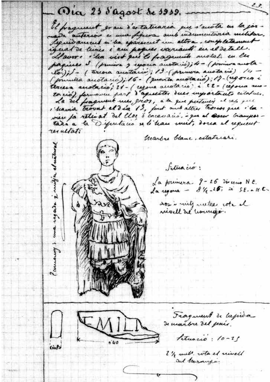
Figura 4. Troballes corresponents al dia 21 d'agost de 1919. Diari d'excavacions manuscrit de Francesc Carbó. Biblioteca de Catalunya (Arxiu d'imatges del MNAT).