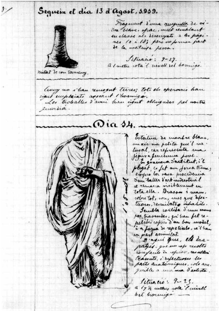
Figura 3. Troballes corresponents els dies 13 i 14 d'agost de 1919. Diari d'excavacions manuscrit de Francesc Carbó. Biblioteca de Catalunya (Arxíu d'imatges del MNAT).