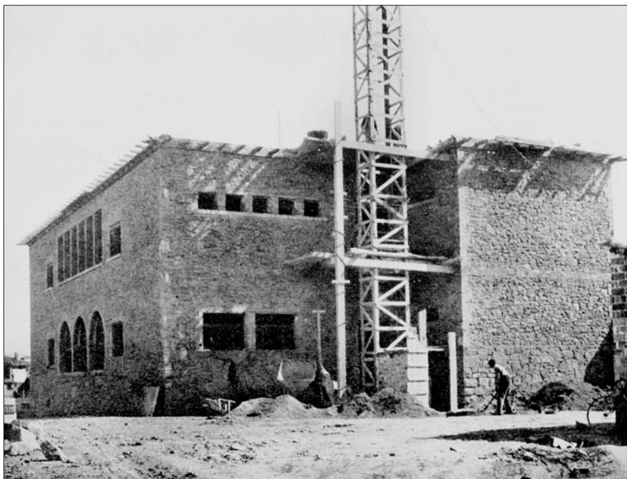
Fotografia publicada a la Revista Vic de l'any 1934 que mostra les obres de construcció del grup escolar Jaume Balmes, al carrer Anselm Clavé de Vic.

següents consistoris haurien de continuar inevitablement. 16 En rèplica a la idea expressada per Manuel Sala en alguns dels seus articles, en els quals donava per fet que l'obra cultural de la ciutat havia començat amb la Segona República. En canvi, des de sectors del catalanisme conservador, es posava l'èmfasi en les etapes anteriors al règim dictatorial, recordant per exemple la feina feta pels antics mestres Espadaler i Morató en l'Escola de Música municipal abans de la dictadura de Primo de Rivera. 17