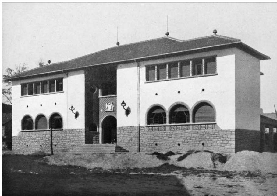
Façana de l'escola pública de l'Horta de Sant Josep de Vic, tal com finalment es va construir.

però en realitat només es va arribar a posar la primera pedra, la resta de l'edifici no es va arribar a aixecar. L'any 1925 es va aprovar la construcció de dos grups escolars, un d'ells es volia construir a la rambla de Sant Domènec, en el solar de l'antic Teatre Principal, destruït per un incendi. El 7 de juliol de 1925 es va fer un pompós acte oficial de col·locació de la primera pedra, amb la presidència del capità general de Catalunya i l'assistència de nombroses autoritats. La primera pedra va esperar eternament la col·locació de la segona; el projecte de l'edifici el van encarregar a l'arquitecte Josep M. Pericas, però va quedar aturat enmig del desgavell en què vivia el govern municipal dels últims anys de la dictadura.