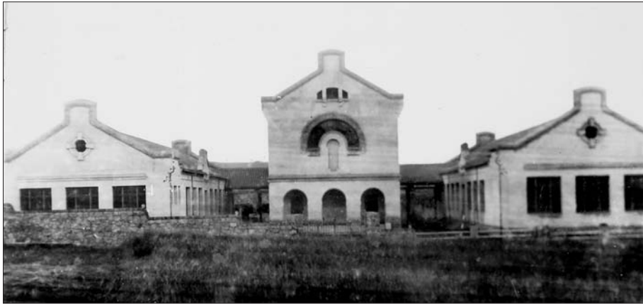
Façana principal de l'edifici de l'escola pública de Centelles, en una imatge de principis de l'any 1937 que es conserva en els expedients redactats pels inspectors de primera ensenyança, conservats a l'Arxiu Històric de la Universitat de Barcelona.

Malgrat la retirada de la subvenció municipal, els dos col·legis privats religiosos van continuar funcionant fins a l'any 1936 finançats a través de les quotes de les famílies. La decisió municipal, coherent amb els nous aires republicans, va introduir un nou element de polèmica ideològica en una població plena de tensions. 50 Les Carmelites, a semblança del que havien fet altres congregacions i col·legis religiosos com El Carme de Manlleu, havien creat el 1933 la Mútua Escolar Argemir, per tal de continuar impartint ensenyament esquivant així la Llei sobre les Congregacions Religioses.