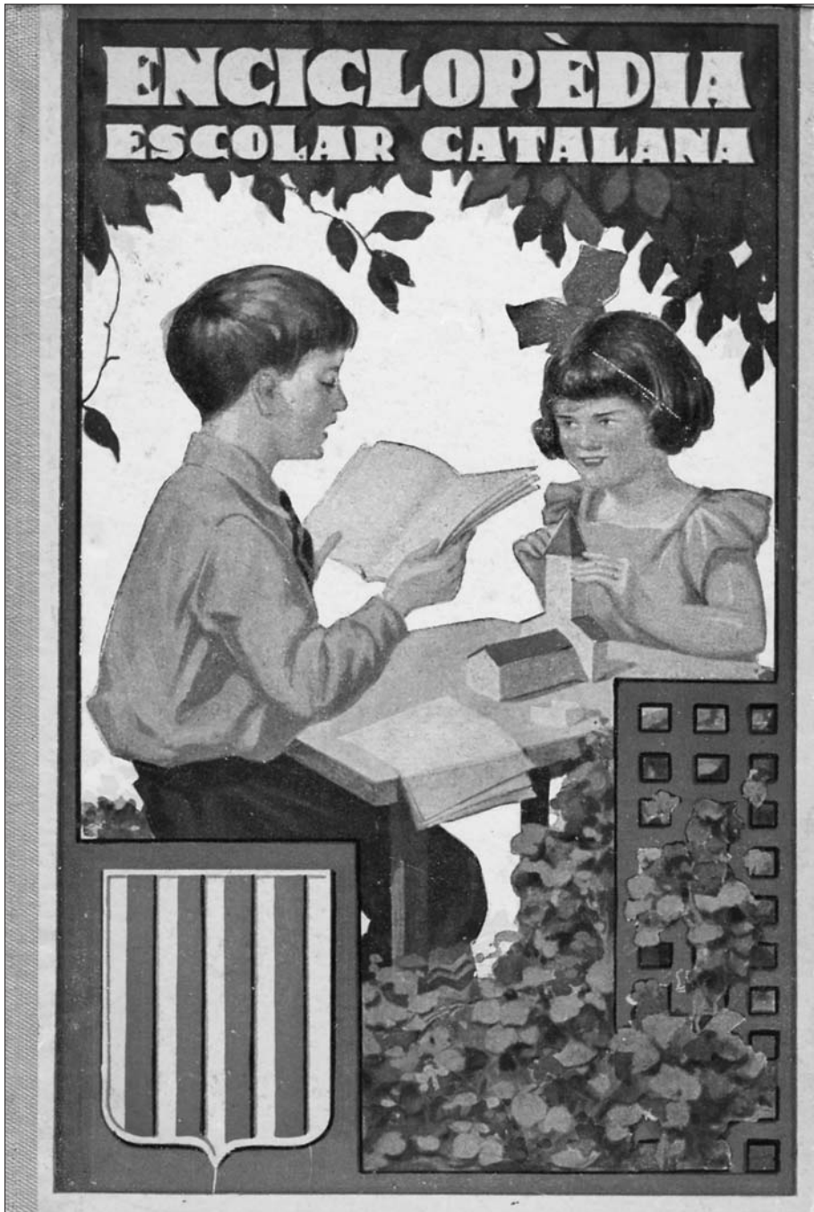
Portada del llibre de text Enciclopèdia Escolar Catalana , utilitzat durant els anys de la Segona República en les escoles públiques.