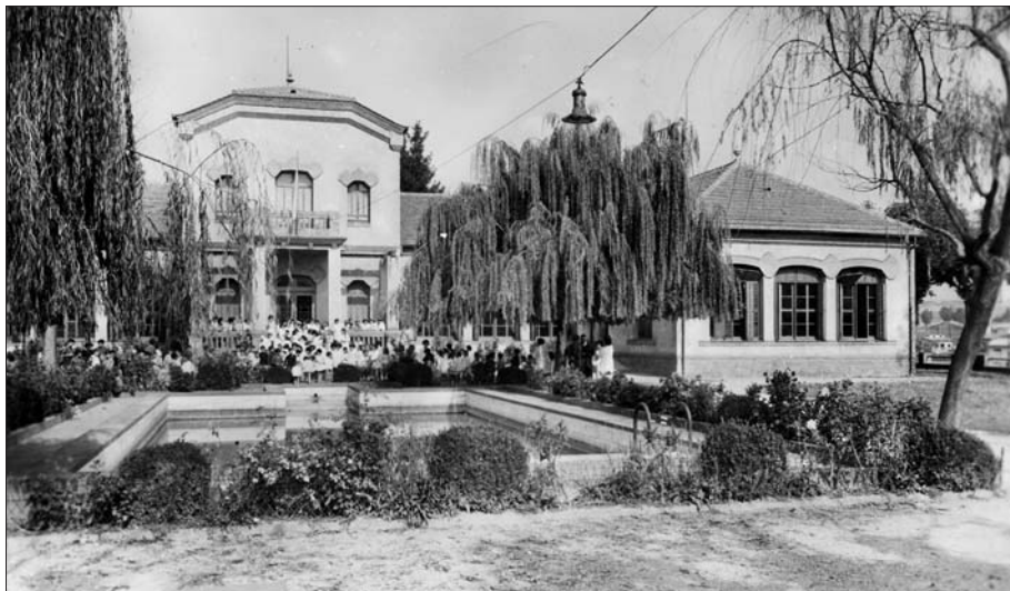
Piscina de l'escola pública de Roda de Ter i grup d'alumnes a les escales d'entrada al centre (postal dels anys del franquisme).

tes entre diversos sectors locals, l'obtenció d'unes escoles graduades era ja un fet irreversible, el febrer de 1932 s'aconseguia la graduació definitiva.