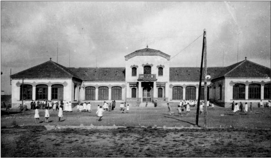
Alumnes jugant al pati del grup escolar de Roda de Ter recentment estrenat.