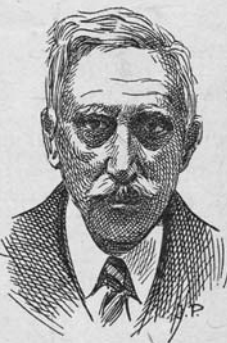
Francesc Macià, president de la Generalitat de Catalunya

Catalunya havia recobrat en principi, amb l'adveniment de la República, la seva personalitat. L'abast d'aquest recobrament ha de fixar-lo el poble, i haurà d'ésser sancionat i aprovat després, a Madrid, per les Corts constituents, com a assemblea sobirana.