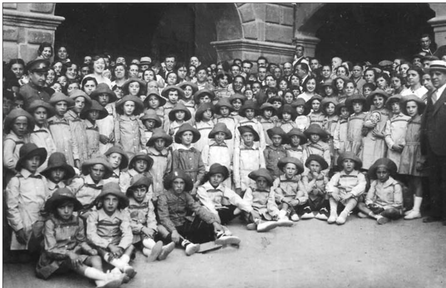
Imatge captada davant de l'Ajuntament de Vic. Grup d'infants que van participar l'any 1931 en les colònies escolars de Torroella de Montgrí. Organitzades pel consistori municipal estaven adreçades als alumnes de les escoles públiques de la ciutat. (Imatge procedent de la Memòria de la Colònia escolar organitzada per l'Ajuntament de Vich. Any 1931. )