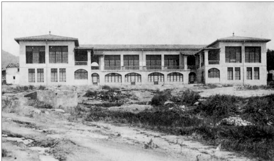
L'escola pública Josep M. Xandri de Sant Pere de Torelló poc temps després de la seva construcció en els anys de la Segona República.

la formació d'un districte escolar únic l'any 1909 entre els municipis de Sant Pere de Torelló i les Masies de Sant Pere, i de l'altra la unió del municipi de la Vola l'any 1926.