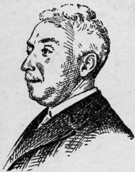
Nicet Alcalà Zamora, president del govern provisional de la República espanyola

I el dia 14 d'abril, sense la més lleu violència i enmig d'un gran entusiasme, fou proclamada la República. Assumí la presidència del govern provisional el senyor Nicet Alcalà Zamora,