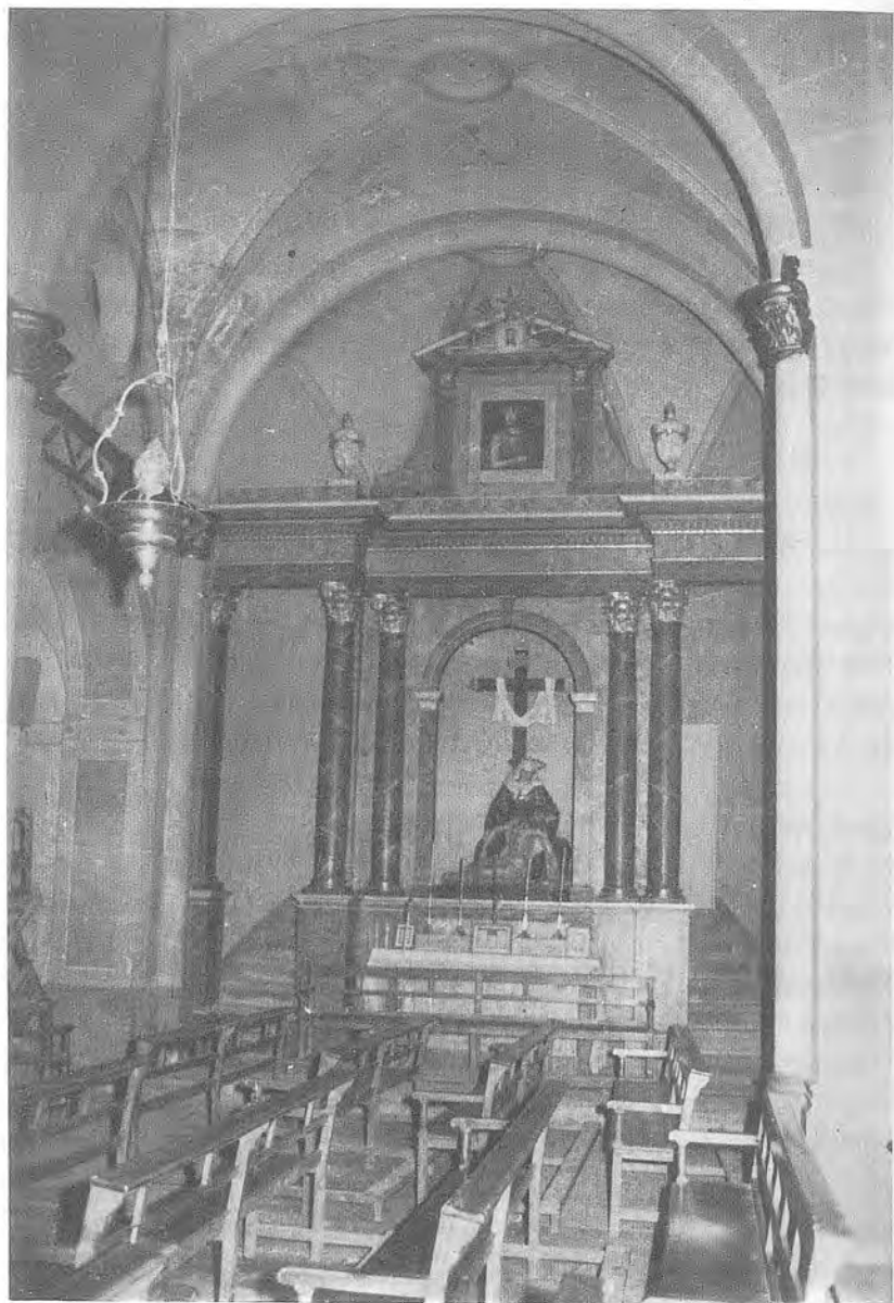
Església de Sant Pere de les Preses. Capella dels Dolors, construïda el 1850 o 1851, situada en el lloc on antigament hi havia la porta d'accés al temple i, per tant, la façana de l'antiga església. De vell antuvi aquesta capella fou coneguda per "l'obra nona". (Foto de l'autor).