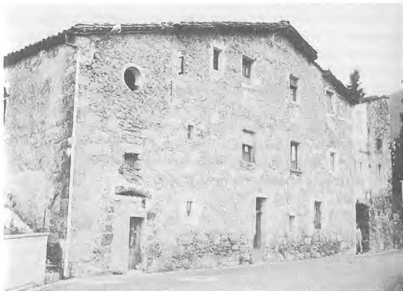
La casa de l'hospital de les Preses, inaugurat l'any 1799. Actualment s'hi estan fent obres per convertir-lo en casa de colònies.

lloc de residència fos a les Preses, ja que prioritàriament eren els malalts pobres de dita parròquia els que tenien dret. Passarem per alt totes les vicissituds per les quals passà fins al període que comença aquest present treball, a fi i efecte de limitar-nos al període 1840-1870, que és el que ens hem proposat de descriure aquí.