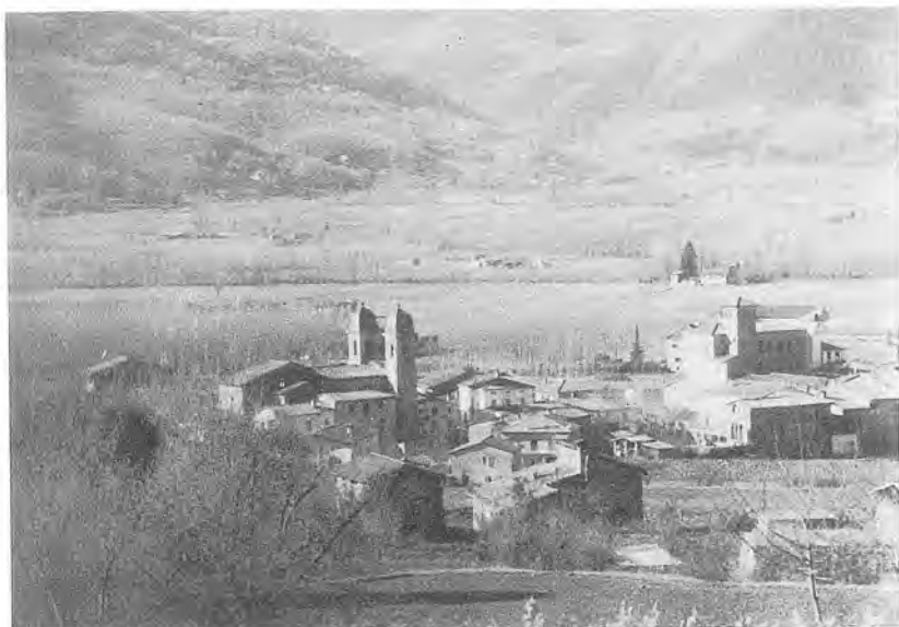
Una perspectiva del poble de les Preses, objecte del present estudi.