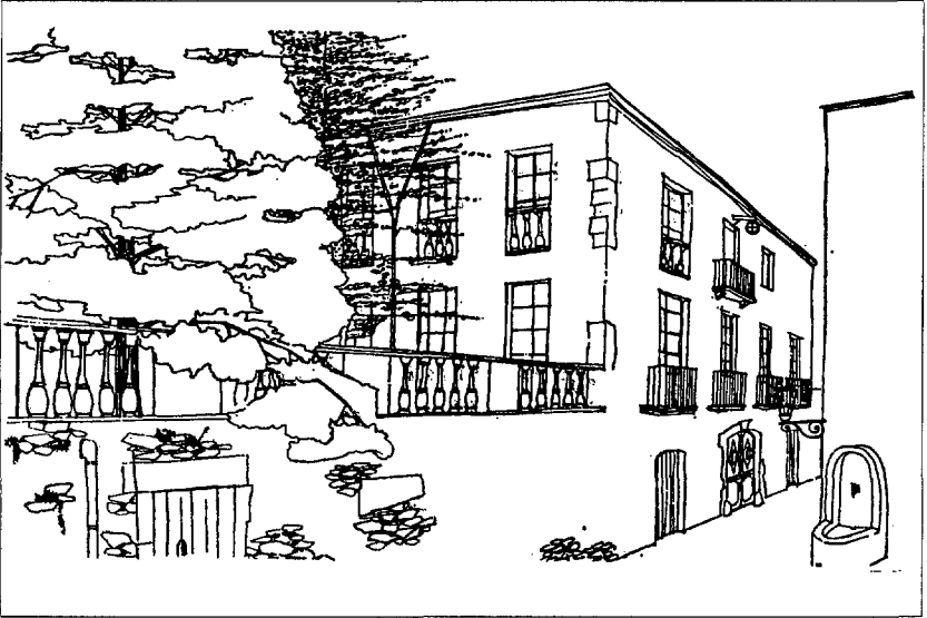
Dibuix de la casa Ferrer (fet per Francesc de Mir l'any 1975).