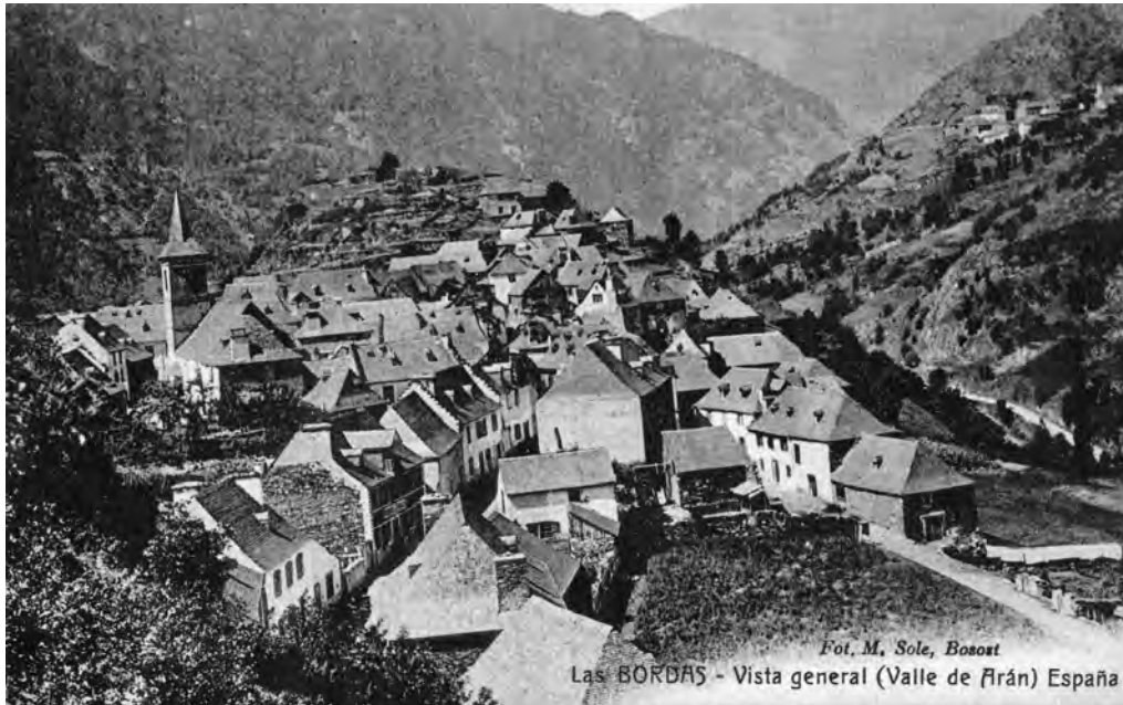
Es Bòrdes. (Archiu Generau d'Aran. Collecion Manuel Solé. Num. 35)

Banhen eth sòn tèrme es arrius Joeu e Garona. Sus era Garona i a un pònt de pèira que comuniqua Es Bòrdes damb Benós e Begós. Sus eth Joeu i a dus pònts, tanben de pèira, un pòrte tà Bossòst e er aute tath bòsc comunau. Eth terren ei granitic e praube, mès favorable entàs peisheus e arbes. Eth monte se ve caperat de bòsqui que dan bona husta entà bastir e boni prats. Trauèsse eth tèrme eth Camin Reiau. Un aute camin de herradura plan perilhós pòrte tà Benasc. Era correspondéncia la receben es interessadi des dera carteria de Vielha.