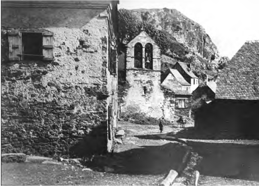
Arres. (Archiu Generau d'Aran. Colleccion fotografies. Num. 1)

Era gent deth pòble son praubi lauradors; un d'eri a eth mestièr de sarte. Se comèrcie damb quauques mules que s'an engreishat en pòble. Aguestes se crompen enes hèires de França e se venen enes hèires de Catalonha. Se crompe vin d'Aragon e dera Conca. Non i a sufisent horment, eth de besonh se crompe en França, enes Vals d'Àneu o en Barrabés. Eth bestiar deth pòble se ven enes dues hèires que i a en Vielha. En França se crompe bèra pèça de ròba.