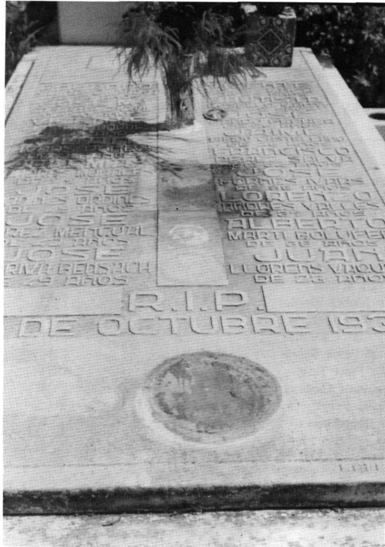
Tomba comuna del cementiri de Dénia, on foren soterrats alguns afusellats d'octubre de 1939.

La memòria dels que recorden els fets, no tenen constància d'aquest detall; potser l'hagen esborrat de les seves ments. De tota manera, pel detall anteriorment esmentat, més bé podríem afirmar que els que anaven a ser executats tenien totes les consideracions dels mateixos que els havien condemnat.