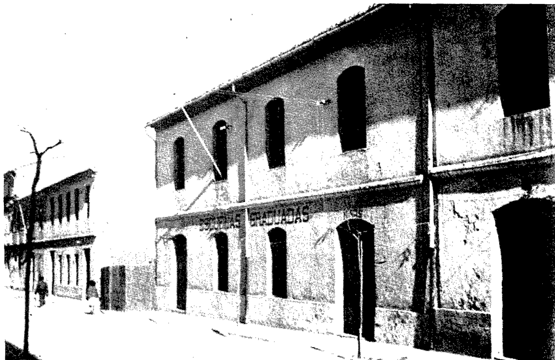
Els magatzems de Morand habilitats com a presons l'any 1939